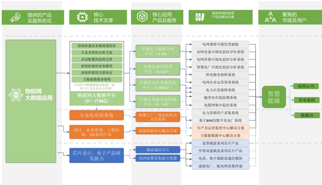
技术及产品战略图