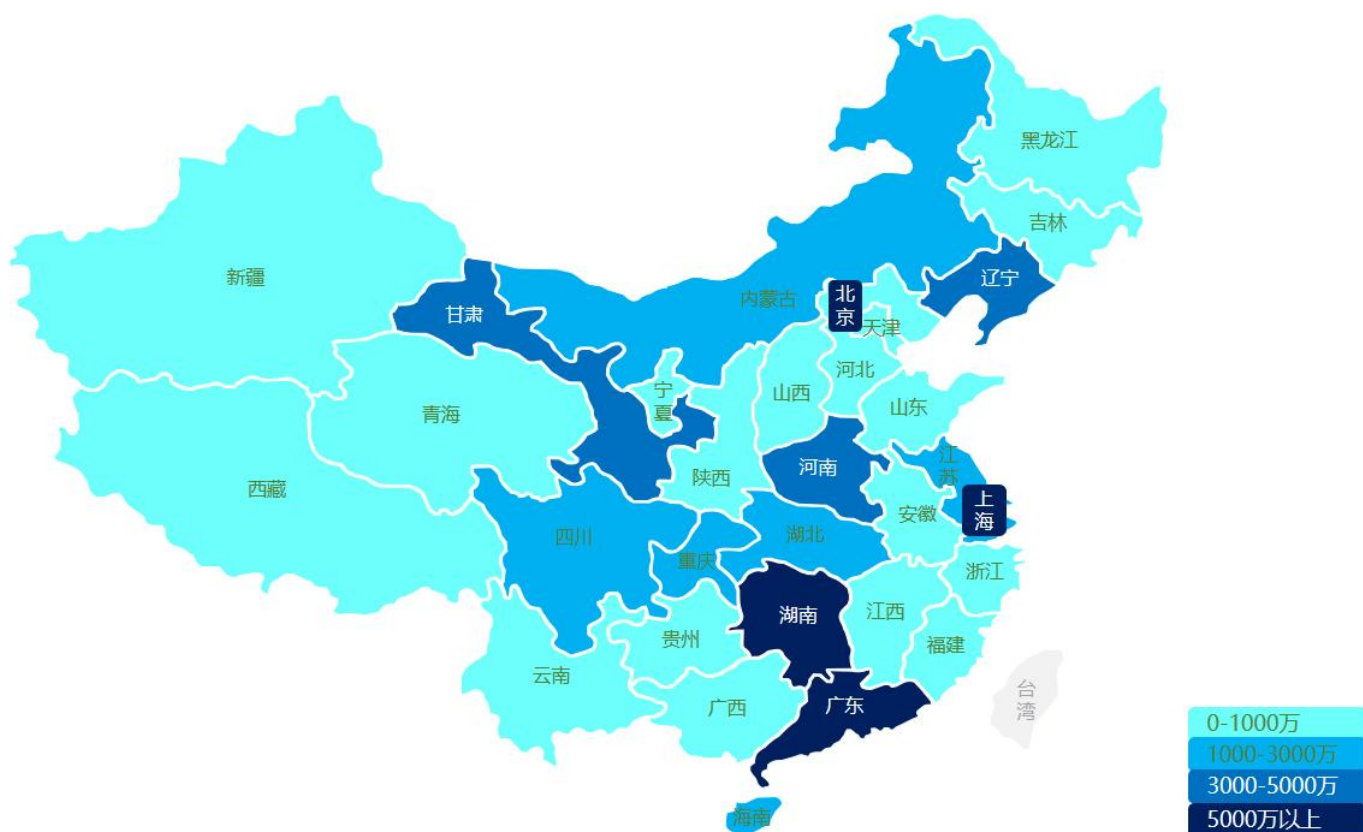
过去三年公司电力行业业绩分布