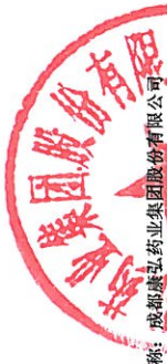
2021年度非经营性资金占用及其他关联资金往来情况汇总表