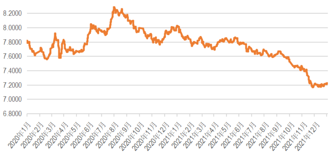
图 欧元兑人民币即期汇率走势图