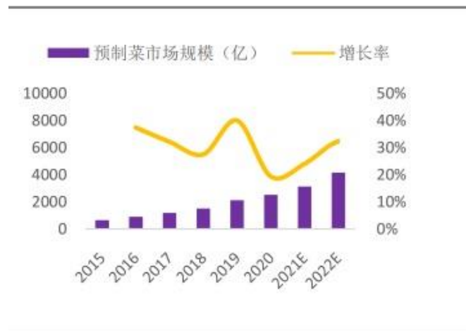
我国预制菜行业规模增长情况

根据中国消费者报数据显示，我国预制菜行业市场规模从2017年的约1,000亿元快速增长至2020年的约2,600亿元，平均年复合增速高达37.51%。