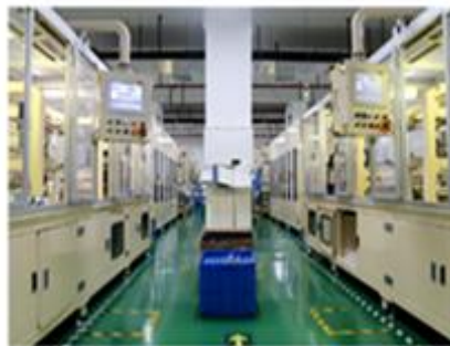
滤芯自动化生产线