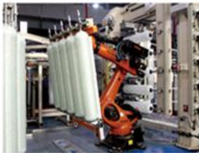
玻璃钢桶自动化生产线