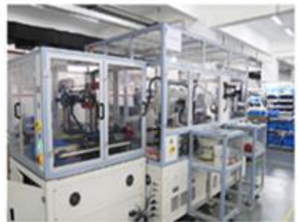
控制阀自动化生产线