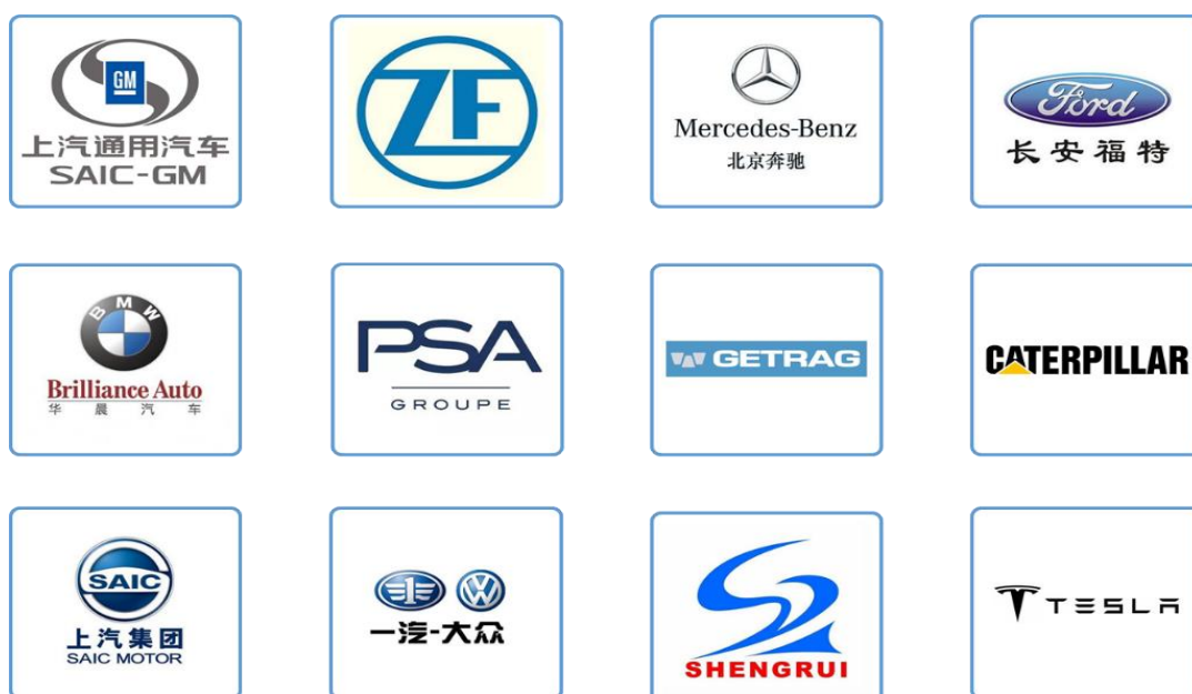
(部分客户 logo 列示)

公司在汽车发动机智能装配线和变速箱智能装配线等动力总成领域居于国内领先地位；在新能源汽车领域，公司在混合动力总成智能装配线、动力锂电池智能生产线、氢燃料电池智能生产线以及新能源汽车驱动电机智能生产线等细分领域取得重大突破。