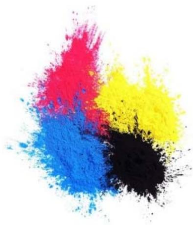
图：彩色及黑色墨粉