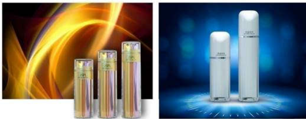
乳液瓶系列产品示意图