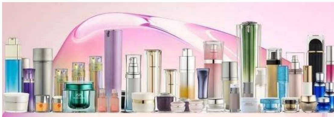
公司主要产品示意图

2022 年 1-6 月公司主营业务毛利率为 14.55%，上年同期为 27.15%，下降 12.60%，主要系募投项目“年产 4,500 万套化妆品包装容器新建项目”已于 2021 年 7 月份投产，目前公司订单量不足，固定成本较高，同时客户发生变化，导致毛利率下降；2022 年 1-6 月归属于上市公司股东的净利润 270.26 万元，较上年同期下降 79.09%，主要系国内上半年多地爆发疫情，上海子公司第二季度由于疫情防控需要，公司销售人员拜访客户开展业务受影响，导致订单量减少，产能利用率低，毛利下降，导致净利润下降。