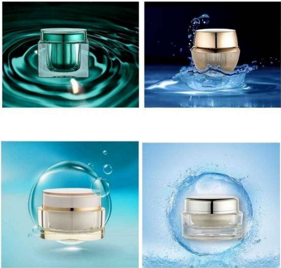
膏霜瓶系列产品示意图