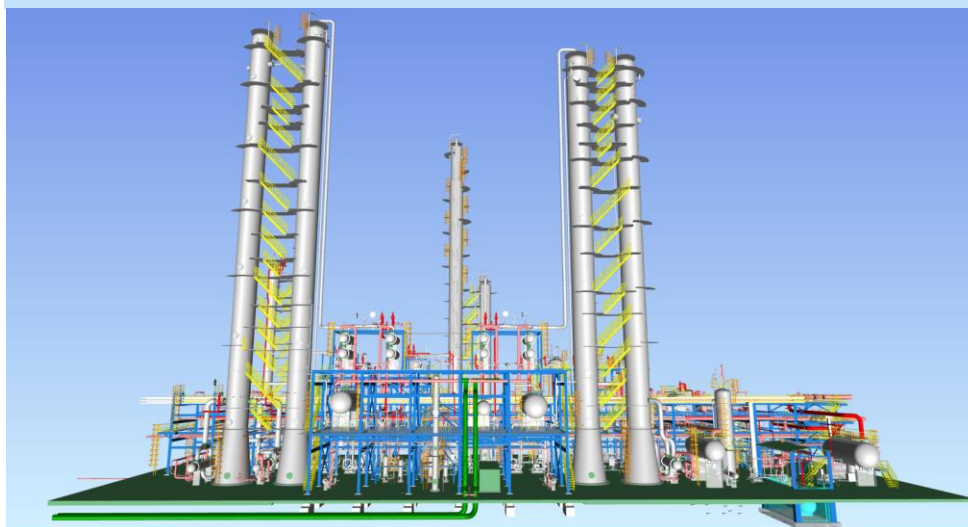
天津南港 120 万吨/年乙烯及下游高端新材料产业集群项目效果图