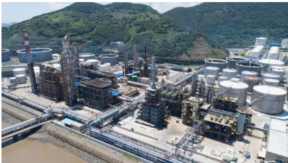
中海石油宁波大榭石化有限公司 160 万吨/年丁烷两段溶剂脱沥青装置实景图