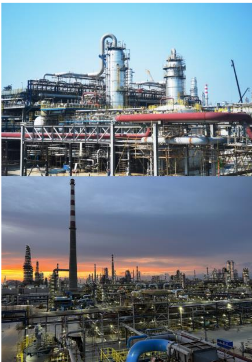
中委合资广东石化 2000 万吨/年重油加工工程主体装置 EPC 项目实景图