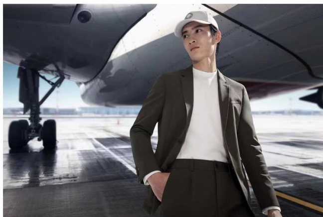
#报喜鸟运动西服,自由无束的理想型西服