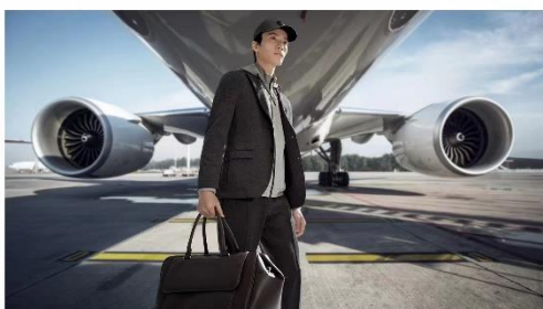
#报喜鸟运动西服,自由无束的理想型西服

1、报喜鸟品牌。报告期内坚定“品牌升级”和“年轻化”的目标，聚焦西服品类，围绕重大节假日和货品波段等时间节点进行品牌推广。公司会员日推出“我们正当红”为主题的直播活动，回馈品牌会员并发布公司新产品运动西服，形成全渠道联动，提升了消费者对报喜鸟西服专家的品类认知；婚礼季期间公司通过微信生态圈和短视频等多渠道构造“草地婚礼”场景化，传播“喜文化”；聚焦目标客户群体，打造“爸气来袭”父亲节主题，构建当下流行的郊外旅行、亲近自然的家庭聚会场景，引发目标客群情感共鸣，有效提升消费者对品牌的认同感。