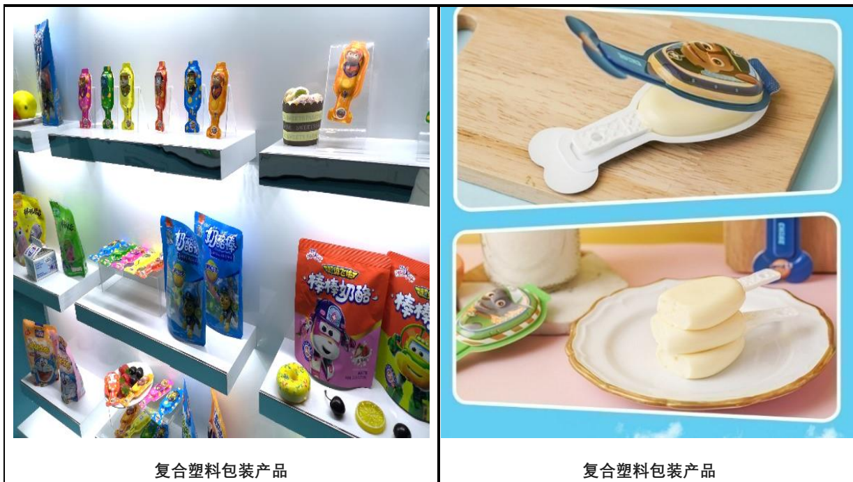
复合塑料包装产品

公司注重包装领域新材料的研发和推广应用，目前相关产品及技术的研发、测试工作进展顺利。复合塑料包装方面，公司相继开发出用于常温储存奶酪棒产品包装片材和同质化环保可回收包装片材，并成功在客户的产品中得到规模化应用。