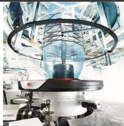
德国W&H共挤复合薄膜生产设备