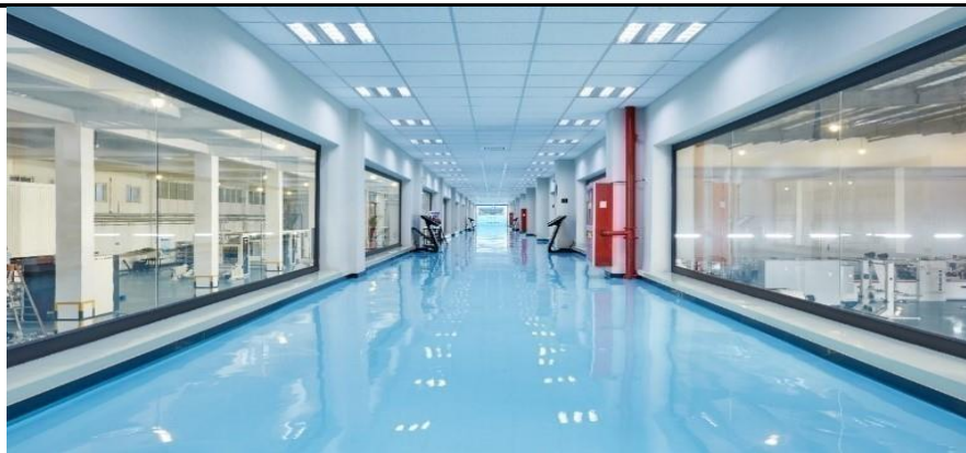
GMP净化-纸包装生产基地