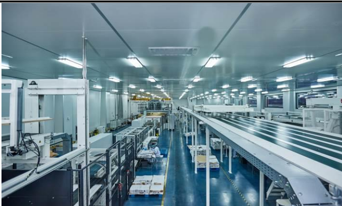
德国W&H全自动数控控制袋流水线

在工业用纸包装生产方面，公司现有四条完整的德国 W&H 全自动 CNC 数控生产流水线，生产效率、大批量订单保障供应能力、产品质量稳定性等方面位居行业领先水平。在复合塑料包装生产方面，公司拥有德国 W&H 三层、七层共挤复合薄膜生产设备共三套，欧洲片材挤出设备一套，欧洲复合设备二套，自主研发和制造的智能熟化、分切、包装、多机器人协同运作的流水线一条，具备较强的柔性化生产能力，可以快速响应客户不同复合塑料包装产品的生产需求。