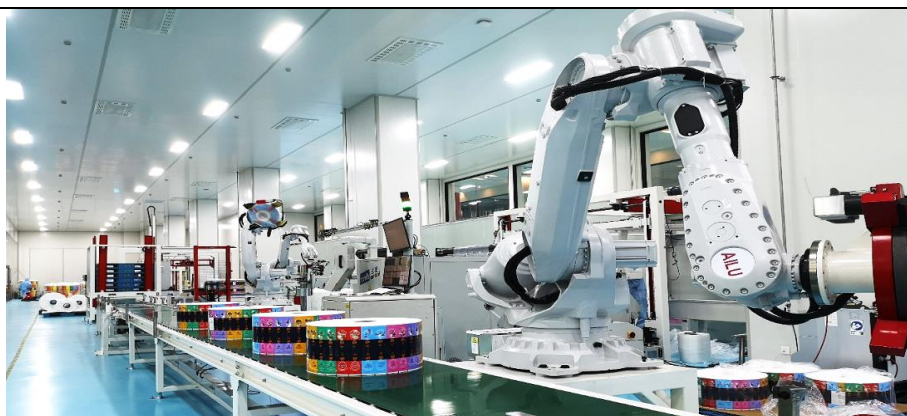
GMP净化-复合塑料包装智能生产线

公司进行了食品、医药、化工等行业全方面的质量体系建设，建有符合食品、医药产品的 10 万级 GMP 净化车间环境。此外，公司先后取得了 ISO 9001:2015、ISO 14001:2015、ISO 45001:2018、ISO 22000:2018、BRC 食品认证、HACCP 食品安全保证体系、Sedex 认证等国际认证。公司通过不断强化和改善品质管理满足国际市场对于产品的要求，增强国内外客户信心，提高国际竞争能力。