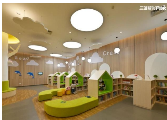
公司产品在图书馆的应用