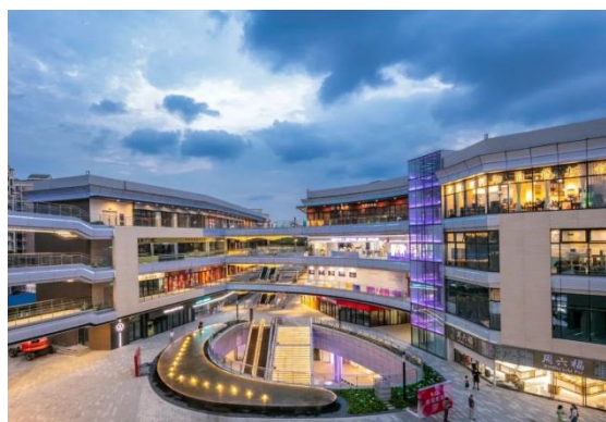
公司产品在商场的應用