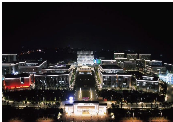
公司产品在户外亮化的应用