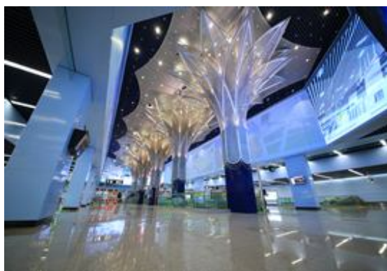
公司产品在地铁的应用