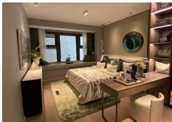
公司产品在住宅的应用