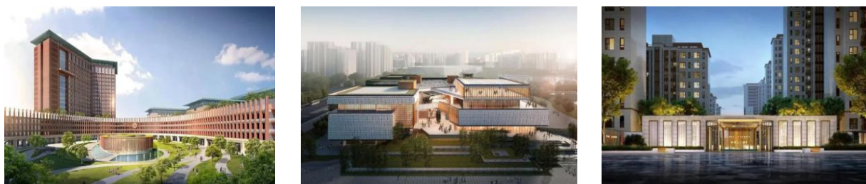
中山大学深圳校区