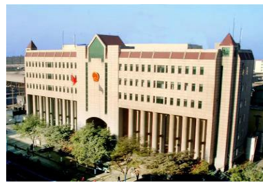
临汾市中级人民法院