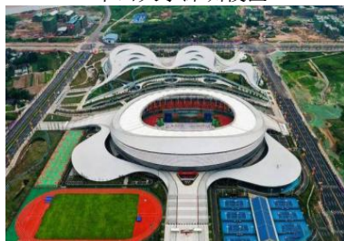
乐山市奥林匹克中心