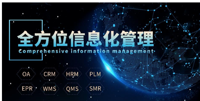
图 5 数字化运营管理平台

为克服外部环境，构筑自身核心竞争力以稳定、可持续发展，报告期内公司强化内控管理，规划信息化建设，为提升整体管理效能夯实基础。以“数项”思维搭建有逻辑、可统筹的统一信息化管理平台，各大信息系统逐步上线，助力公司进一步升级管理机制、提升环节运作效率、解决流程瓶颈、加强资产管理。