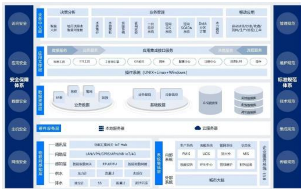
图 1 智慧水务应用平台架构图

等为主的智慧供水管网端软件服务平台，系统之间的数据通过 SaaS 云平台进行无缝交换，使水务公司各个业务部门的工作流实现了融合，实现管网资产全生命周期管理，消除了数据孤岛现象，为水司管理层的决策提供智慧辅助。