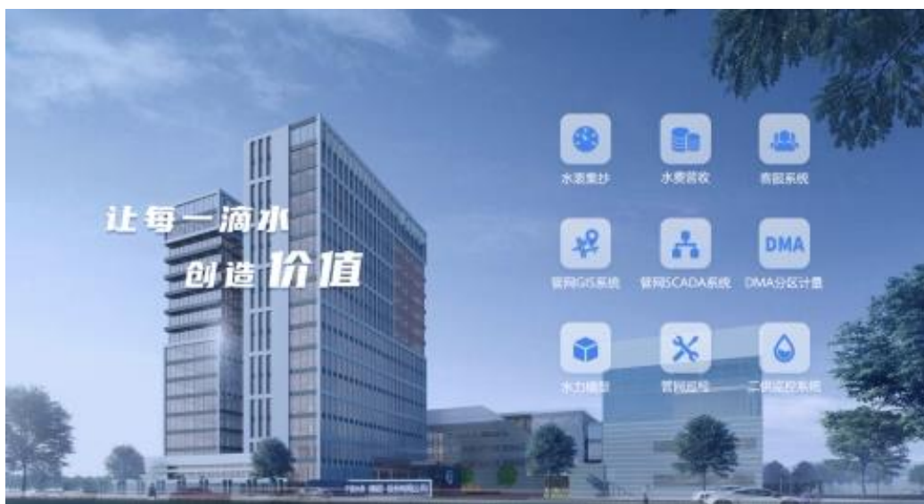
图 2 智慧水务应用平台示意图