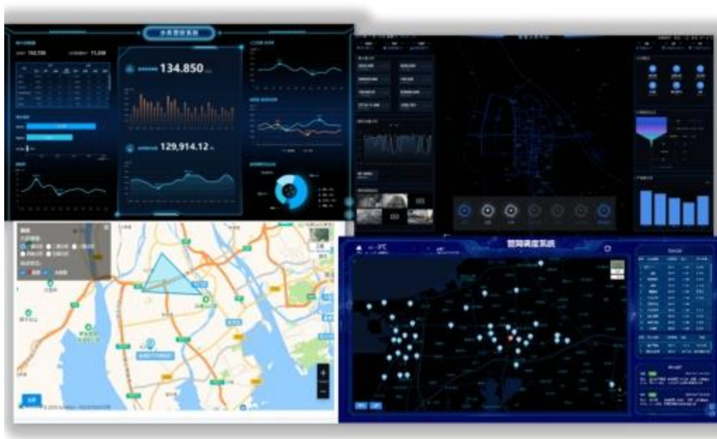
图 3 主要平台展示图

管网调度中心： 以 GIS 地理信息系统为基础，集成管网监测 SCADA 系统和管网区域计量 DMA 系统，建立“一张图”，包含水源、水厂、管网及用户的从源头到龙头的“全业务”链，可以实时显示管网的运行状态和管网供水状况，包括管网供水压力、水厂出水 and 用户用水的水量和水质的实时信息。