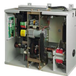
中高压断路器操作机构