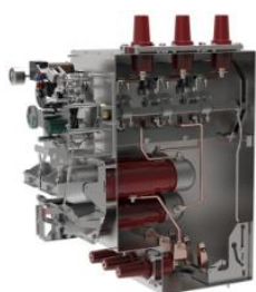
环网柜组合电器单元气箱