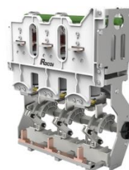
环网柜断路器单元开关