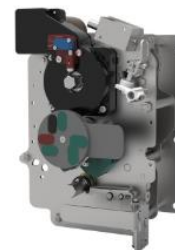
环网柜组合电器单元操作机构