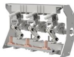
环网柜负荷开关单元开关