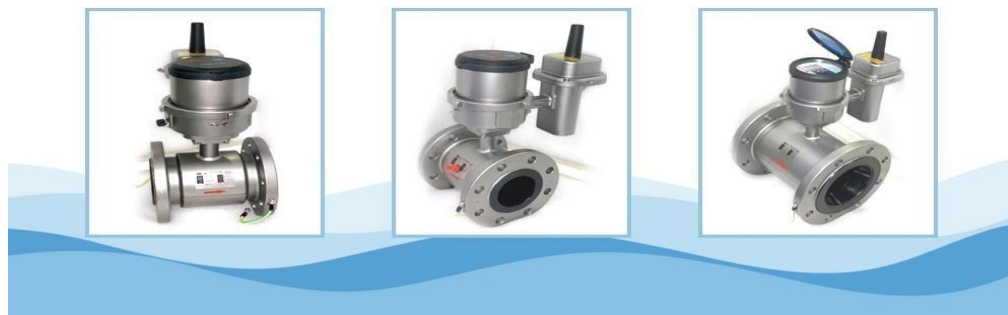
电磁水表实物照片

2、电磁水表。电磁水表是一种根据法拉第电磁感应定律来测量管内水流量的感应式计量仪表。与传统机械计量水表比较，电磁水表具有零磨损、低压损、宽量程、高灵敏度、易实现功能扩展等优点。比如可以选配压力传感器，检测安装点管道压力；采用 NB 或 GPRS 数据远传，实现远程抄表。该产品特别适用于管网监测和 DMA 分区计量管理，帮助水司及时发现漏点、减少漏损、降低产销差率。