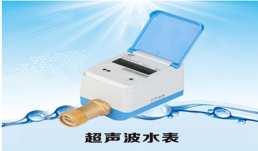
多感知超声波水表

3、多感知超声波水表。基于 5G 通信技术，能实时感知水量、水质、水压、水温等多种参数的一款水表。其主要特点：①超声波计量，计量精度高并可计量正、逆向流量；②集成水质传感器、温度传感器、压力传感器，可实时判断当前水质的优劣，对超低超高水温进行预警，对管网压力进行检测，及时发现爆管或渗漏事故；③数据海量存储，可循环存储 120 月结数据、120 天日结数据、50 条故障记录、2000 条事件记录；④产品具有红外通讯接口，接受固件升级，也可通过通信网络实现远程升级。