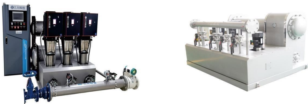
无负压供水设备实物照片

4、无负压管网叠压稳流给水设备。即无负压供水设备，是一种加压供水机组，它直接与市政供水管网连接，在市政管网剩余压力基础上串联叠压供水，确保市政管网压力不小于设定保护压力的二次加压供水设备。主要用于高层供水，并配备监控系统，实现对供水机组的监测与控制，具有动态画面、状态监视、远程控制、报表处理、统计分析等功能。与传统的水池供水相比，无负压供水设备基础投资小，设备全封闭运行不会对水质造成二次污染，管网叠压及变频控制，用电节能 30% 以上，属于绿色环保产品。