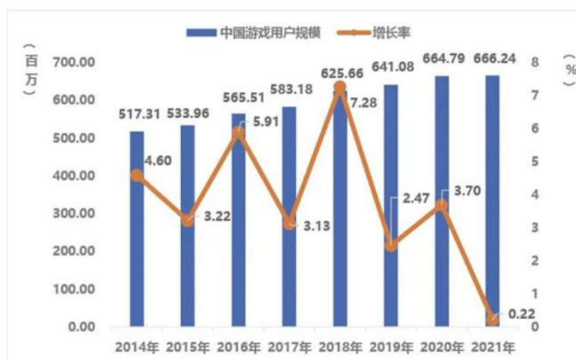
中国游戏用户规模及增长率

此外，国内游戏用户规模 6.66 亿，同比增长 0.22%。伴随防沉迷新规落地和未成年人保护工作逐渐深化，用户结构将进一步趋于健康合理。