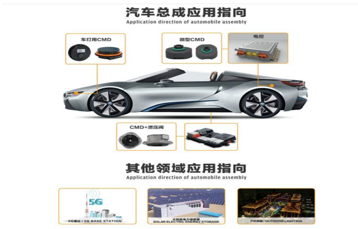
图 3：CMD 的应用