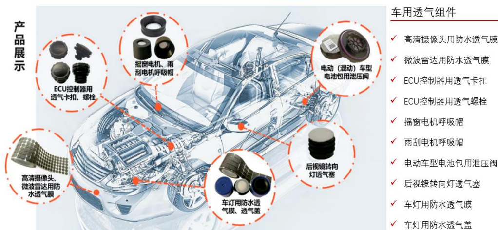
图 1：ePTFE 在汽车领域的应用