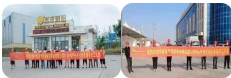
陕西铭帝铝业分布式光伏项目、山东菏泽中铂物流园分布式光伏项目

截至本报告披露日，公司已中标金昌润鑫永昌河清滩 120MW 光伏发电项目、国电投福建长城华兴玻璃屋顶分布式光伏项目、内蒙古乌兰察布市四子王旗国通物流商贸城“源网荷储”一体化 EPC 总承包项目、泉州闽汉宏盛新能源有限公司屋顶分布式光伏电站项目 EPC 总承包等重点工程，合计中标 EPC 总承包光伏项目装机容量约 200MW。与辽宁阜新市细河区人民政府、国电电力福建新能源开发有限公司、国家电投集团江西电力有限公司新能源发电分公司、国家能源集团海南电力有限公司等央企及行业大型企业达成战略合作意向，未来各方拟在清洁能源产业领域积极开展广泛合作。