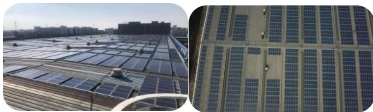
江苏常州瑞悦分布式光伏项目、上海联合制罐分布式光伏项目