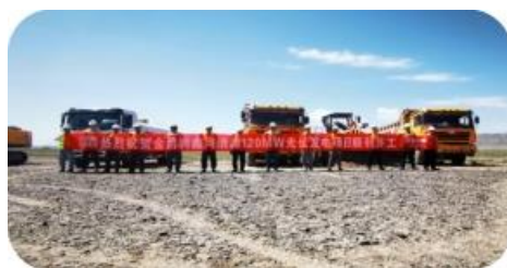
甘肃金昌润鑫永昌河清滩分布式光伏项目