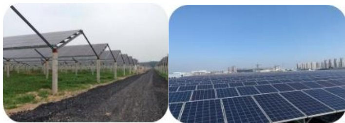
安徽萧县新庄地面集中式光伏、江苏常州德协分布式光伏项目

该业务以子公司上海熠冠为主体，设立项目公司，在江苏、上海、安徽、湖北、广东等光照资源较好及经济发达的地区开拓项目，与大型企业、园区管委会、高校合作，以合同能源管理方式，建设运营光伏项目，为用户提供先进、高效的能效管理解决方案。截至本报告期末，上海熠冠持有运营集中式地面光伏电站 20MW，分布式光伏电站 40 多 MW。