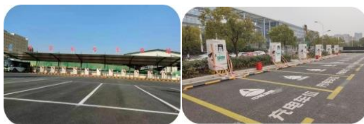
邯郸市公交 16 号充电站、杭州市云狐充电站

随着新能源汽车革命带来的新能源和新交通融合，“光储充”一体化充电站逐渐成为充换电基础设施发展的主流方向。报告期内，公司在福清生产基地、武夷山燕子窠生态茶园投建光储充一体化充电站示范项目，通过“以光养桩”实现新能源智能化相互支撑的绿色充电模式，快速为新能源汽车充电，实现绿色低碳、降本增效。