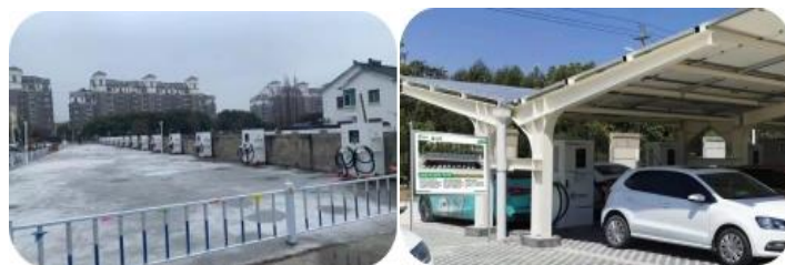
苏州市渭塘充电站、福清光储充一体化示范站