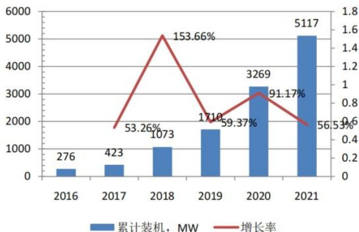
中国电化学储能累计装机规模