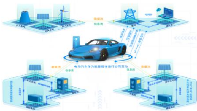
能源互联网的典型场景