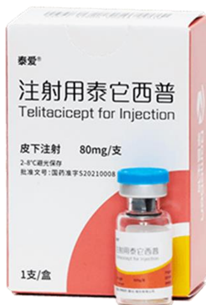
图一：注射用泰它西普