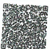
邢红源年检二维码

本证书经检验合格, 继续有效一年。 This certificate is valid for another year after this renewal.