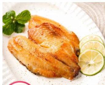
新奥尔良风味鱼排