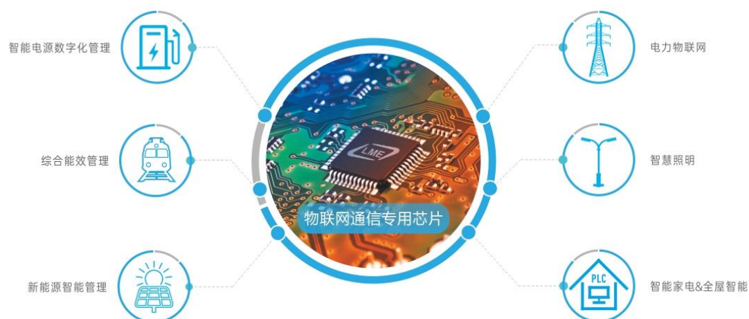
公司物联网通信芯片主要应用领域

公司以电力线通信芯片为核心，已在市场批量销售的产品包括 500kHz 以下窄带 PLC SOC 芯片及通信模组、窄带 PLC+433 无线双模通信 SOC 芯片及通信模组、12MHz 以下宽带 PLC SOC 芯片及通信模组、集成 32 位高速处理器、大容量存储的宽带 PLC SOC 芯片及通信模组产品；以及面向行业市场的信息化、数字化、智能化的通信终端和平台软件完整系统解决方案。