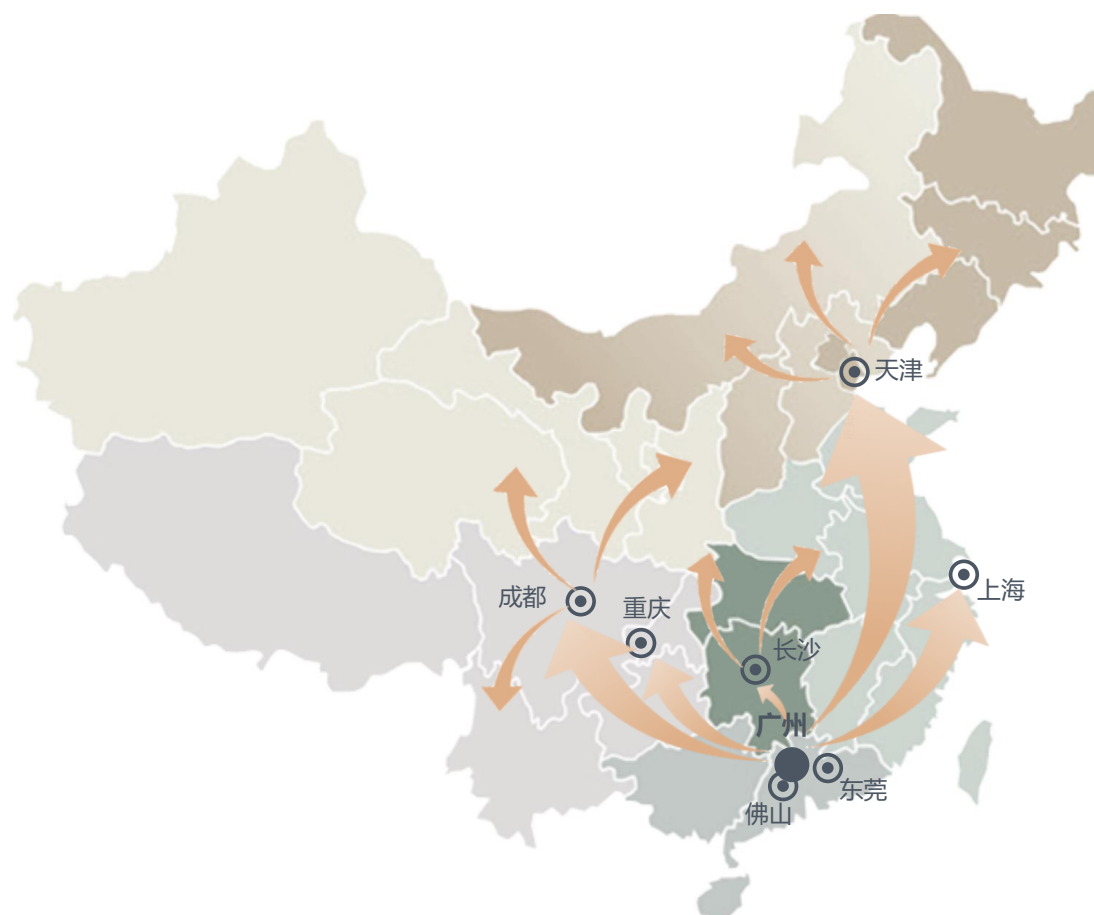
公司营销网络情况

得竞争的关键因素。而受纳米二氧化硅产品应用领域广泛，下游客户所在地较为分散的行业特点影响，拥有一个可以覆盖目标客户的完善营销网络，则成为纳米二氧化硅生产商形成快速客户响应能力的前提条件。