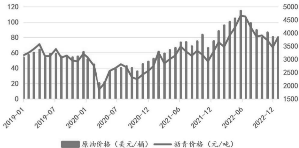
2019年-2022年原油与沥青价格

2019 年-2022 年，国内沥青市场价格与国际原油价格走势一致。2020 年 1 月至 5 月期间，受国际石油市场供应严重过剩、合约即将到期等因素影响，国际原油市场布伦特原油现货价格在 2020 年 3-5 月触底，国内沥青市场价格亦于 2020