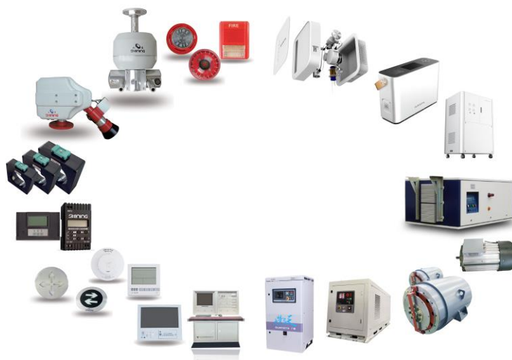
电力电子装备示意图

电力电子板块由消防报警设备、电源、电机、制氧设备业务组成，其中消防报警设备是该板块核心业务。消防报警设备依托于全资子公司山鹰报警，主要产品有二线制火灾控制报警系统、智能应急照明和疏散指示系统等，现有产品包含9个系类211种型号。电源、电机业务主要用于配套公司空港装备电动化、零部件销售和整车销售，可显著降低配套产品成本，提高产品质量，同时也作为零部件和产品对外销售。制氧设备作为医疗板块重要协同，可应用于移动医疗车辆和大空间供氧，配合公司医疗板块战略布局。