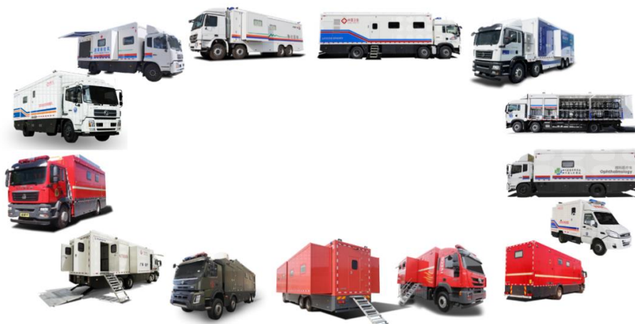
移动医疗保障装备示意图

术优势，产品性能达到市场领先，未来有望成为公司重要利润增长点。移动医疗装备从开始的单一产品（体检车）发展到至今，现已形成检验、影像、门急诊、手术、重症监护、防疫、后勤保障七大作业单元，具备先进的设计理念、成熟的制造工艺以及强大的特殊舱体研发能力，目前已经成为业内领先的方舱医疗车专业制造厂家，在移动CT车、移动生物实验室、5G卒中单元、车载CT储能电源等产品市场具有优势。现已具有配置全科甲级移动医疗和医疗应急处置能力，产品也正在向高端智能方向发展。