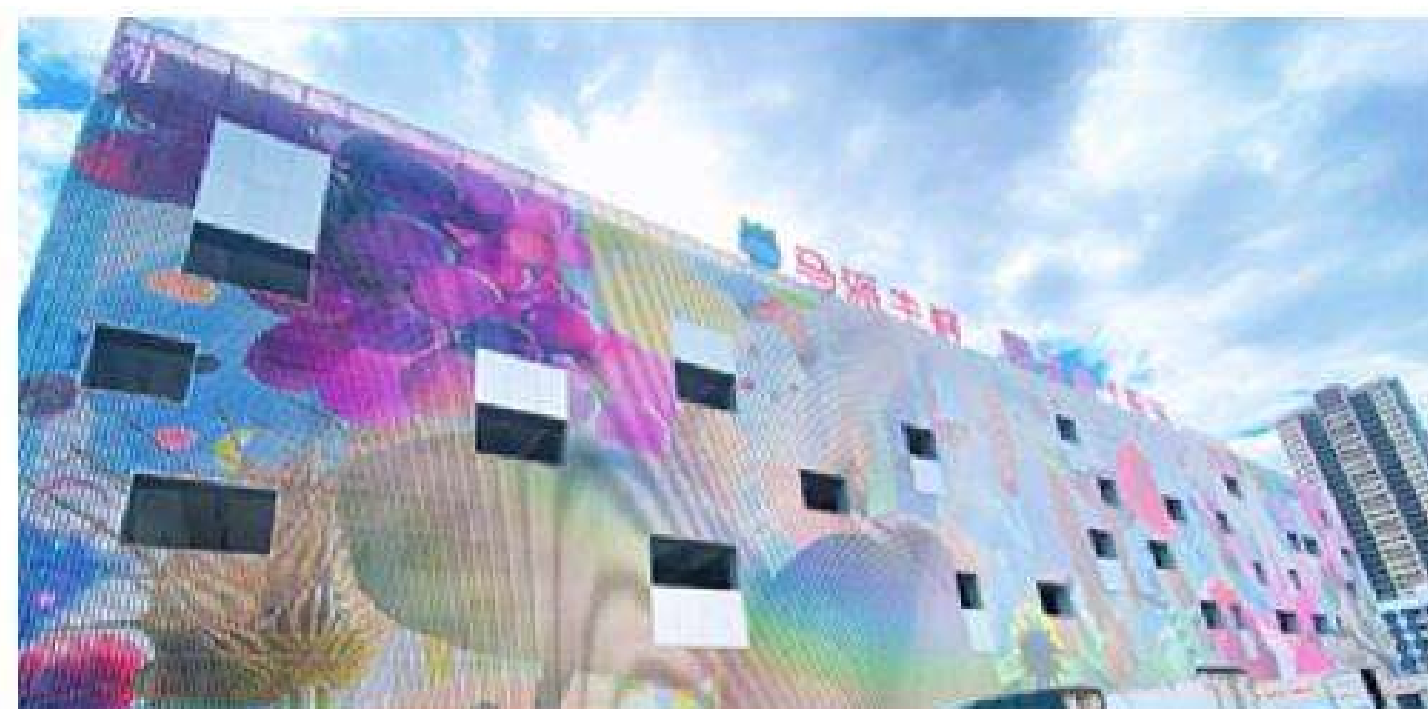
温州市水果批发交易市场