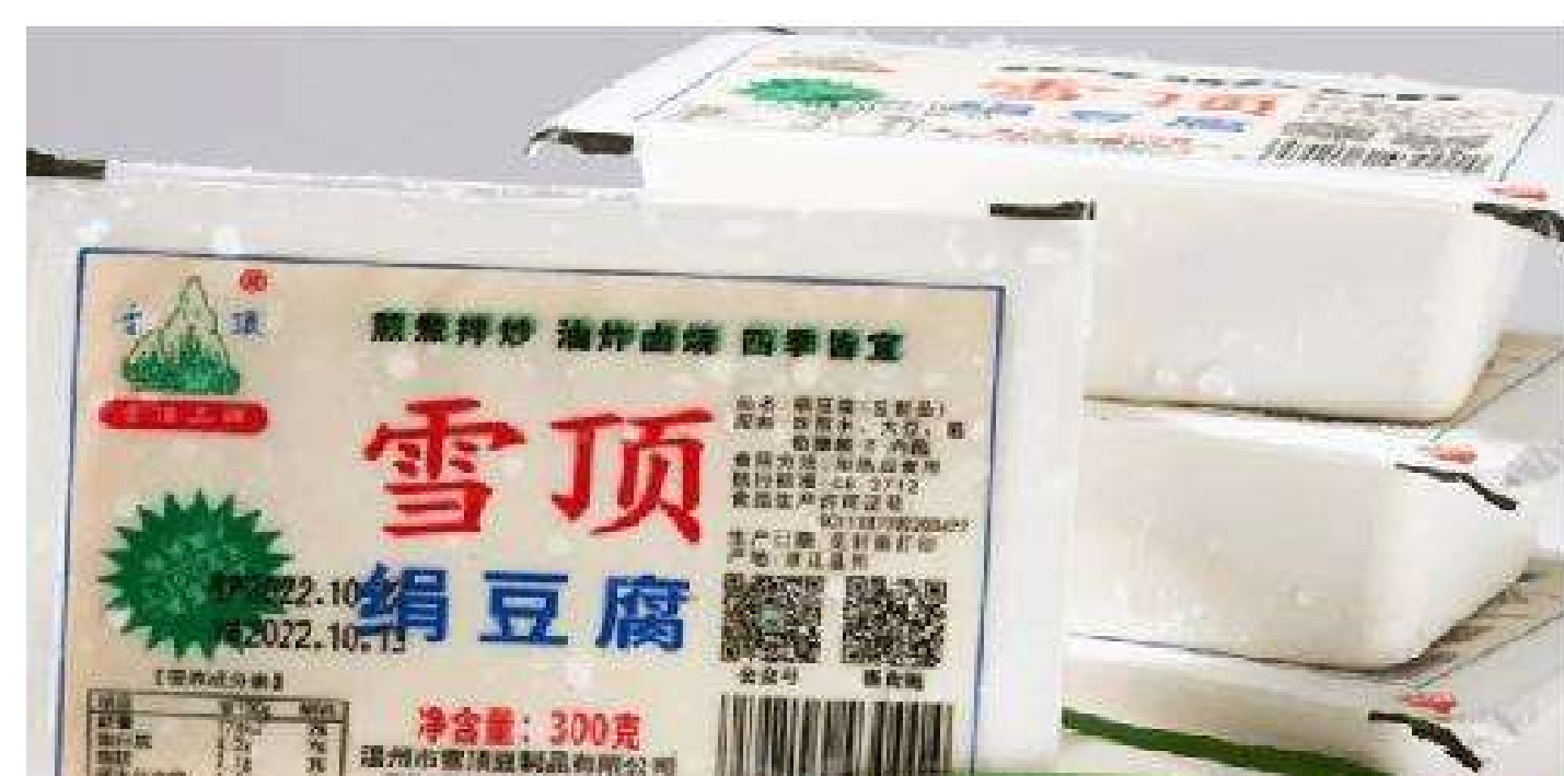
温州市雪顶豆制品有限公司