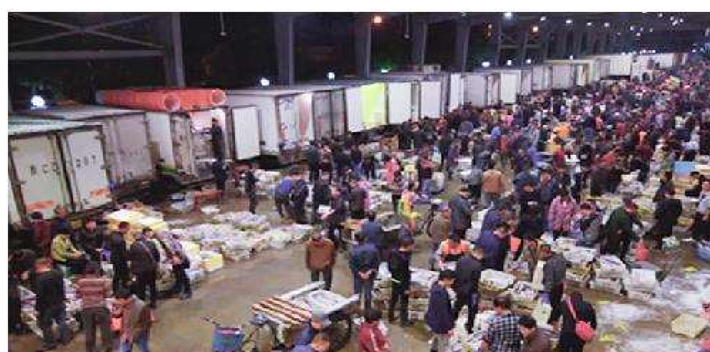
温州市水产批发交易市场