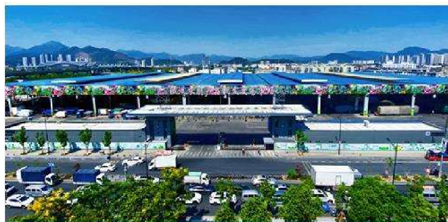
温州菜篮子农副产品批发交易市场