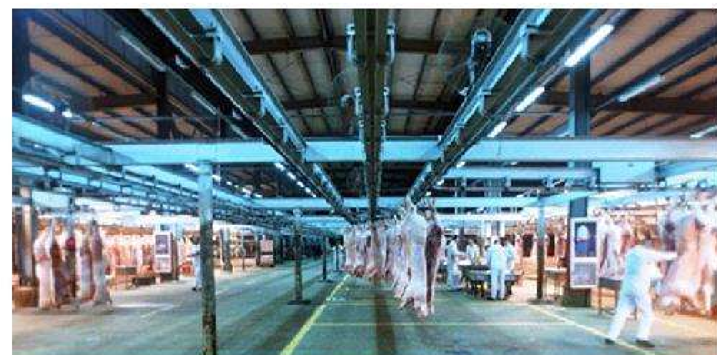
温州市生猪肉品批发交易市场