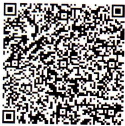
唐炫的年检二维码