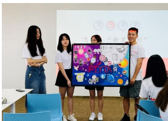
飞亚达 2022 届“新星计划”培训

公司招聘工作始终秉承公开公正公平原则，实行市场化选聘机制，在公司业务发展进程中为员工提供舞台，在雇主品牌建设的道路上探索前行。持续开展应届生校园招聘计划，不断吸引优秀人才的加入。