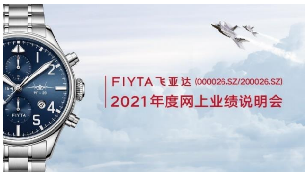
飞亚达 2021 年度网上业绩说明会

交所互动易平台直面中小股东，及时回复投资者提问共计 191 条，回复率 100%；积极与机构投资者定向交流，持续向资本市场传递公司价值，由此获得推荐研究报告 17 篇；通过投资者热线电话，耐心倾听中小投资者声音。