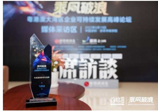
2021 年度履行社会责任杰出企业 “飞亚达”-2022 粤港澳大湾区“年度最具影响力品牌”