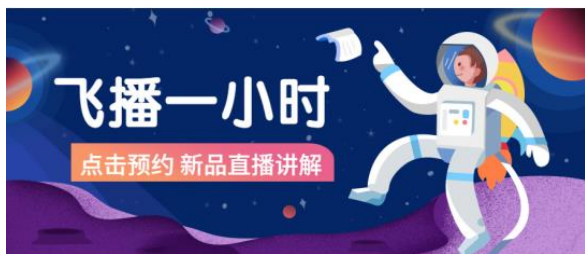
飞播一小时 | 新品核心卖点知多少

线下平台重点依托飞亚达培训中心，以公司企业文化、企业战略为核心，整合协调培训资源，建立完善的学习与发展体系，从领导力、渠道力、品牌力、产品力和顾客服务五个重点方向制定人才培养规划，满足员工在知识学习、经验分享、技能提升、能力培养等方面的需求。