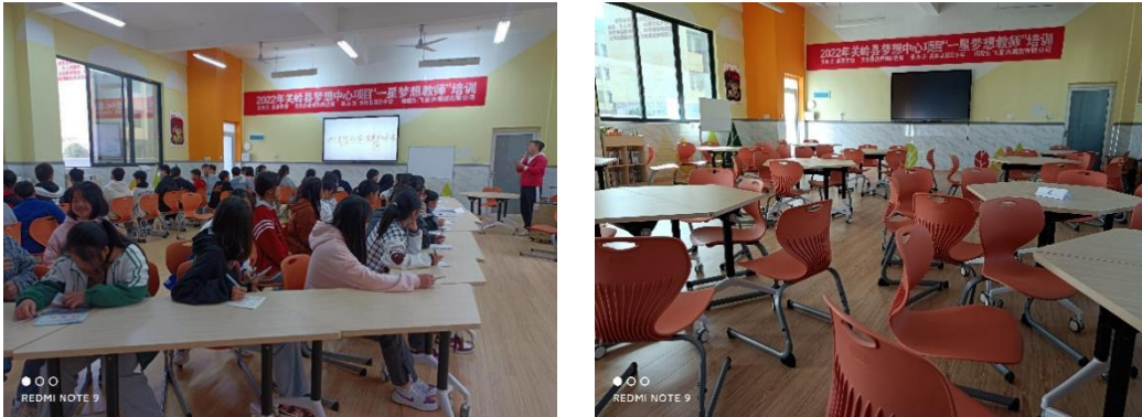
飞亚达 2022 年“梦想中心”项目

三中学作为 2022 年“梦想中心”的合作学校。飞亚达梦想中心具有一套完善的素养教育公益体系，覆盖了 5 年的梦想课程实施费用（包括梦想课程开发推广、教师培训、教师研讨及奖励、IT 系统开发与推广、学校活动、课程运营人员薪酬等）。每一间梦想中心均按照标准配备了平板电脑、投影仪、彩色课桌和 500 余册课外书籍，以让更多的中小學生能够享受到先进的素质课程。自 2012 年起，公司已先后在贵州、福建等 11 个省捐建了 32 间梦想中心，帮助了 38,848 位贫困地区的孩子享受到优质的素养教育课程。