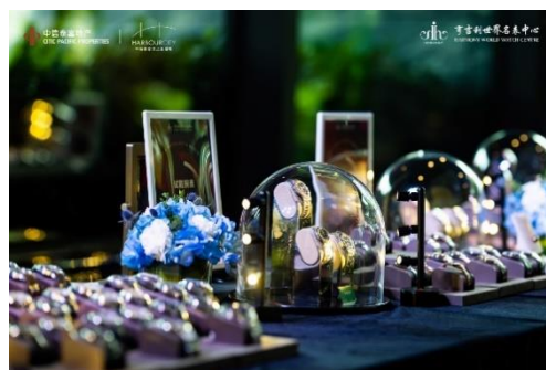
亨吉利积极开展跨界活动

报告期内，公司持续推进面向会员的运营体系建设。“飞亚达”品牌持续优化CRM系统，为顾客提供更系统的专业服务。“亨吉利”名表零售借助数字零售系统深耕精细化运营，持续推进顾客研究、顾客价值挖掘，为顾客提供更优质的服务体验。