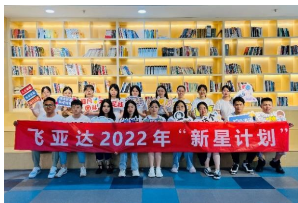
飞亚达 2022 届校招新员工风采