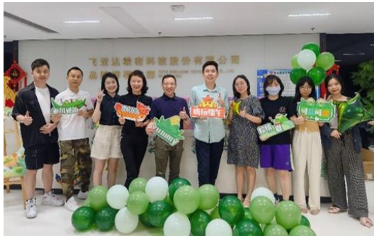
粽情粽意端午活动