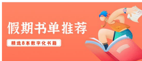
假期书单推荐 | 精选8本数字化书籍

线上通过学习平台开展培训课程学习和考试，通过 HR-Time 企微公众号以“图文+直播+视频”的形式辅助传播，打通链路，形成闭环。