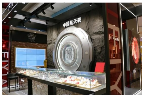
飞亚达品牌航空航天主题店

2022年，“飞亚达”品牌明确“以航空航天表为特色的高品质中国手表品牌”定位，围绕航空航天DNA调整升级门店形象，结合事件营销、联名跨界、会员沙龙等形式开展整合营销，为顾客展现立体而全面的品牌形象。“亨吉利”名表零售积极与汽车、证券、银行等开展跨界活动，通过丰富多样的推广活动，拉近与顾客之间的距离。