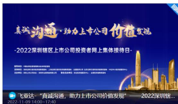
飞亚达 2022 年投资者网上集体接待日