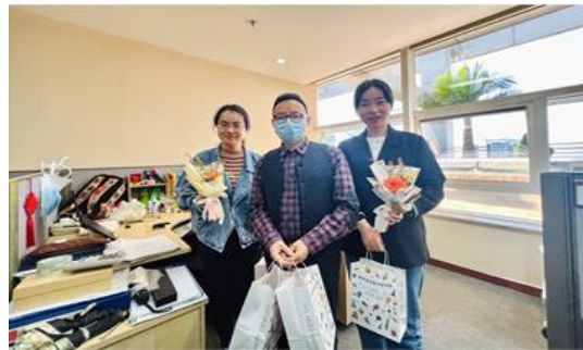
三八妇女节主题活动