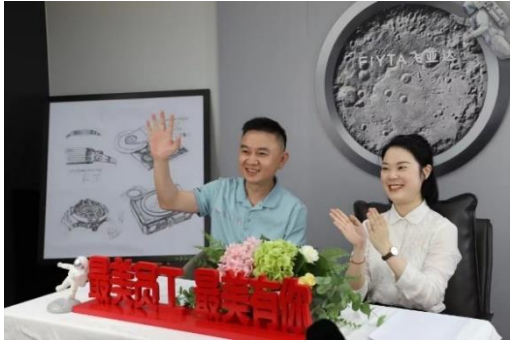
“最美员工”表彰活动