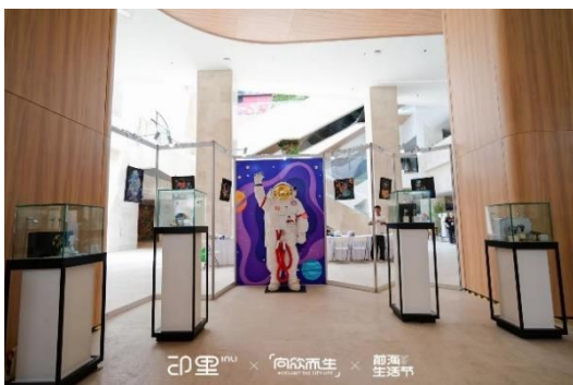
前海印里数字 IP 生活节