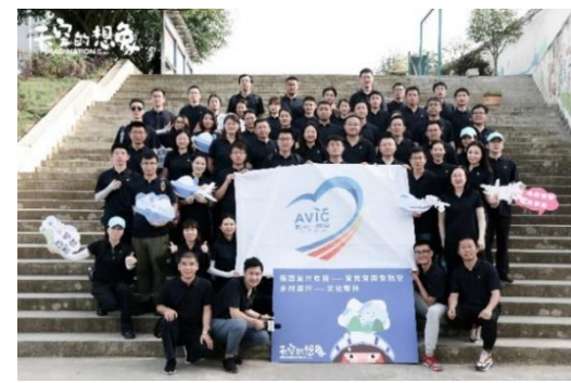
“强国复兴有我——爱党爱国爱航空乡村振兴——文化帮扶”首场活动