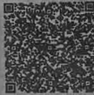
循环年审检二维码

本证书经检验合格，继续有效一年。 This certificate is valid for another year after this renewal.