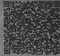
乔琪的年检二维码