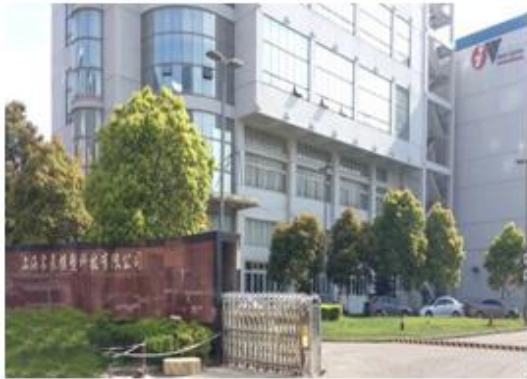
图 1：上海名辰模塑科技有限公司