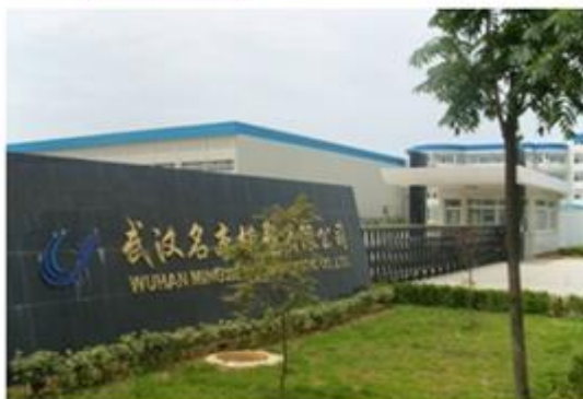
图 3：武汉名杰模塑有限公司