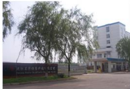
图 4：沈阳名华模塑科技有限公司