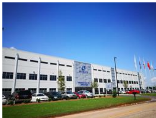
图 9: MINGHUA DE MEXICO, S.A. DE C.V.