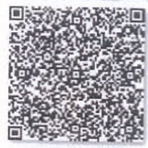
马宁的年检二维码.png