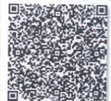
马宁的手检二维码.png