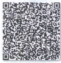
赵玮的年检二维码.png