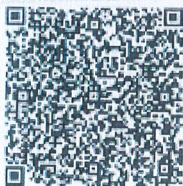
岑敬的年检二维码

本证书经检验合格, 继续有效一年。 This certificate is valid for another year after this renewal.