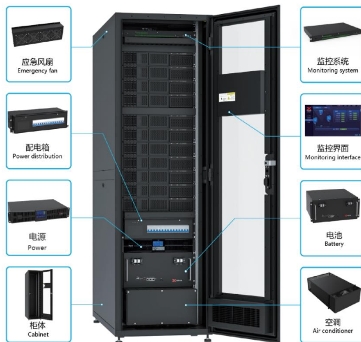
图：一体化机柜结构图

机柜及配电类产品主要由柜体结构件、应急风扇/空调等构成，可以为电池、电源及运营商主设备提供放置与安装环境空间。机柜及配电类产品可单独销售，也可以与电源类、电池类产品集成为一体化机柜进行销售。与分布式安装不同，采用一体化机柜方案，可以节省安装空间，提升安装效率，降低维护成本。一体化机柜产品主要形态如下图所示：