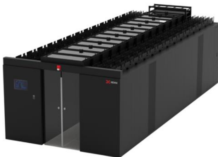
图：微模块数据中心

公司数据中心产品主要包括智能微模块数据中心、封闭冷通道、IDC 机柜等产品，主要为数据中心机房提供供电、数据传输、物理支撑及散热等功能。产品主要形态如下：