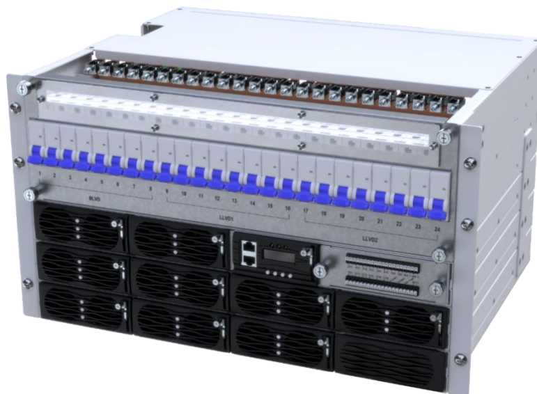
图：嵌入式高频开关电源

公司电源类产品主要是为基站相关设备提供交直流配电、开关电源、过载保护等功能的器件。公司电源类产品可以单独销售，也可以根据客户需求随同公司其他产品集成为解决方案类产品出售。公司独立销售的电源类产品形态主要如下图所示：