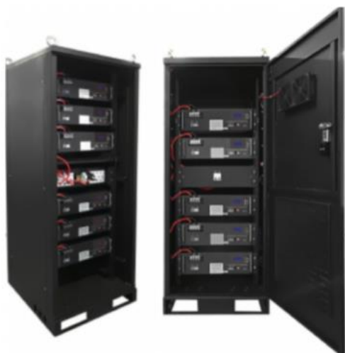
图：通信电池系统产品

电池类产品主要为磷酸铁锂方形电池，具有体积小、重量轻、电池自维护和管理、使用方便、节能环保等特点，主要应用于通信领域的储能备电，在通信设备外接电力发生故障时，提供通信应急电力供应保障，可独立销售，也可以根据客户需求随同公司其他产品集成为解决方案类产品出售。电池类产品主要形态如下：