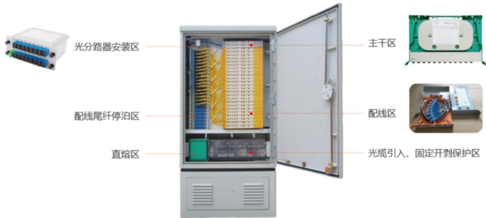
图：无跳接光缆交接箱