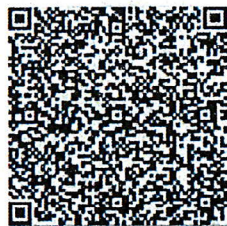
对帐的年检二维码

本证书经检验合格，继续有效一年。 This certificate is valid for another year after this renewal.