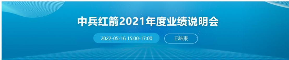
图 7 中兵红箭 2021 年度业绩说明会