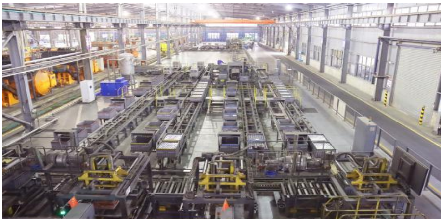
图 10 智能化制造生产线

2022 年，公司节能减排指标持续下降，万元可比价产值化学需氧量排放量同比下降 4%，万元可比价产值综合能耗同比下降 7.5%；公司绿色低碳发展取得实效，2022 年万元可比价产值二氧化碳排放量同比下降 8%。子公司中南钻石入选河南省级“绿色工厂”并完成公示，迈向了高质量发展的绿色工业转型之路。