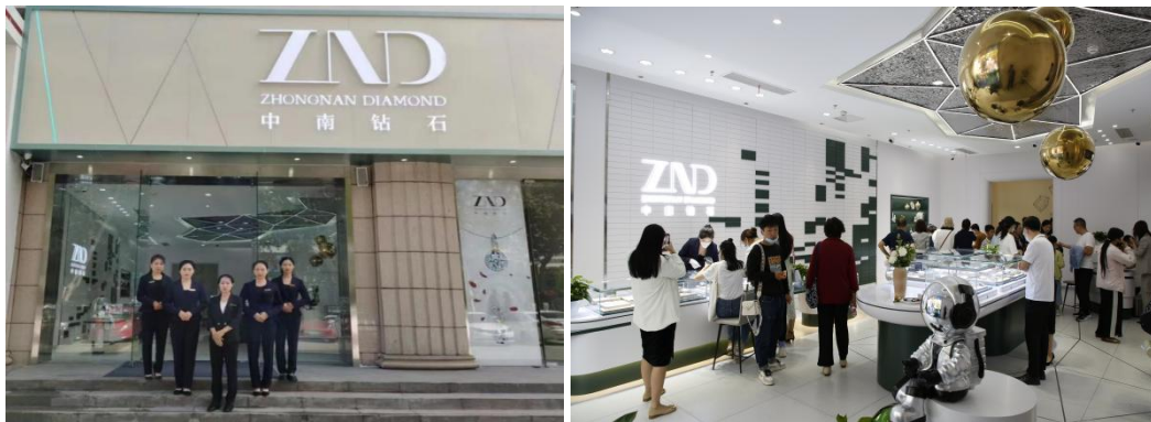
图 2 中南钻石南阳红都时代广场形象店