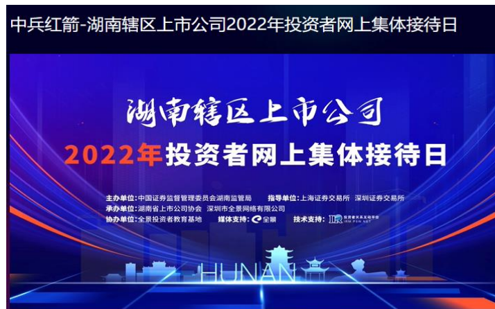
图 8 参与湖南辖区上市公司 2022 年投资者网上集体接待日

2022 年，公司通过召开年度业绩说明会、参加湖南辖区投资者网上集体接待日、回答投资者互动易平台提问等形式，累计回答投资者提问 224 条。通过电话会议举办机构投资者调研 1 次，超 140 余家机构 196 人参与。其中，机构类型及家数如下：