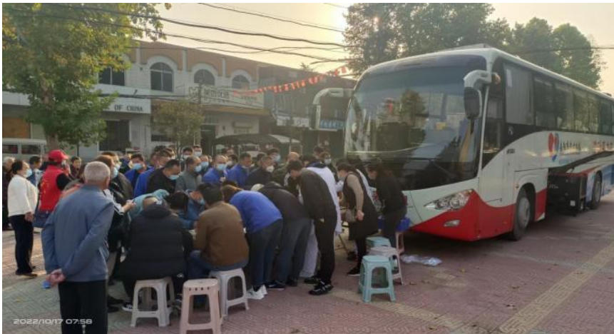
图 16 志愿者踊跃献血现场

公司想国家之所想，尽企业之所能，坚决贯彻“人民至上、生命至上”要求，勇担社会责任，捐赠资金为困难地区采购卫生特殊车辆；全力以赴完成民生保供生产任务，助力市民“菜篮子”工程；组织开展科学防护宣传、社区特殊时期值守，为打赢这场没有硝烟的战争贡献力量；响应上级工会号召，搭建职工互助献爱平台，组织参加中国职工发展基