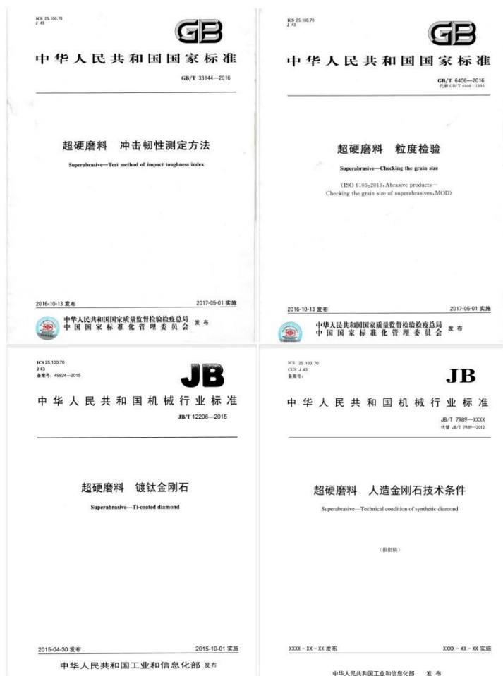
图 5 中南钻石参与制定、修订行业标准示例

其中，中南钻石正在制定的《超硬磨料 冲击韧性测定方法》国际标准，是超硬材料行业首个获得立项的国际标准，依托本项目，中国成为 ISO/TC29/SC5/WG8 工作组协调国、组长国、秘书处所在国，负责本标准制定和超硬磨料领域其它标准项目运行，极大提升了中国超硬材料在世界上的市场地位和话语权，为中国超硬材料的高质量发展打下坚实基础。