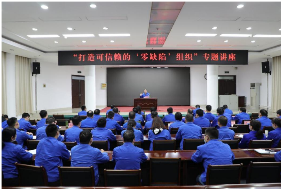
图 14 打造可信赖的“零缺陷”组织专题培训

公司重视职工个人素质及能力提升，大力开展形式多样、内容丰富的培训。设置党建工作、科技引领、深化改革提质增效、安全环保、风险防控等培训专题，开设“周五课堂”持续开展管理人员素质能力提升培训，全年共组织开展十九届六中全会精神、党的二十大精神、安全生产法专题、国企改革、管理技能等各类培训 46 期 1300 余人次。同时利用线上学习资源，组织全公司各类人员积极参加专业领域课程培训，共计 4200 余人次。