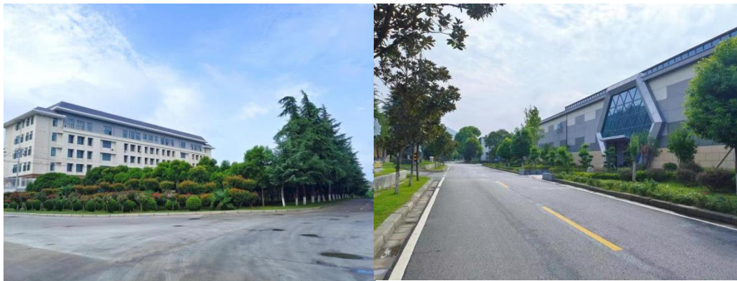
图 12 环境整治后焕然一新的办公场所

公司牢牢坚持发展为了人民的思想，坚定不移贯彻新发展理念，矢志不移推动企业做大做优做强，让全体职工共享企业发展成果。建立为群众办实事长效机制，大力实施环境整治和亮化美化工程，推行铺设生活区主干道、设置健身器材、筹建购物中心、职工食堂、浴池等生活娱乐设施。落实困难职工精准帮扶长效机制，开展“新春慰问、夏送清凉、金秋助学、冬送温暖”服务，解决职工子女入学等一系列民生问题，帮助职工解决实际困难。以科技创新、工艺提升推进人机隔离、机器换人、黑灯工厂工程，保障职工生命财产安全，使职工切实感受到企业的关怀和温暖，激发了广大职工干事创业的热情。