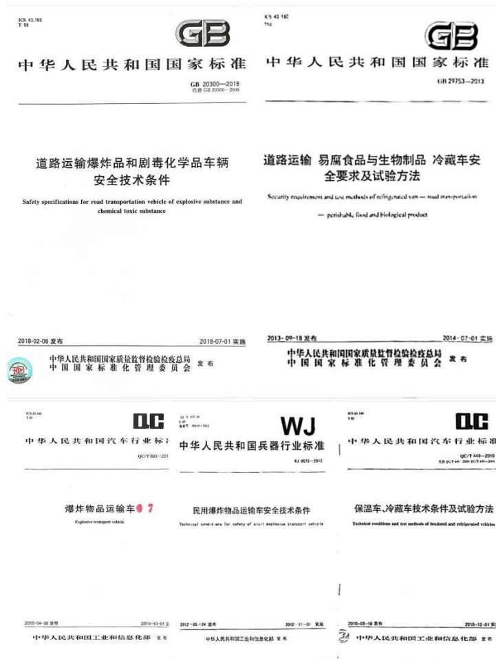
图 6 红宇专汽参与制定、修订行业标准示例

红宇专汽设备保障能力在国内同行中位于前列，拥有省级企业技术中心、河南省危险品运输车工程研究中心和工程技术研究中心，拥有各类专利 100 余项。先后制定/修订 GB20300-2018《道路运输爆炸品和剧毒化学品车辆安全技术条件》、QC/T993《爆炸物品运输车》、WJ9073—2012《民用爆炸物品运输车安全技术条件》、GB29753-2013《道路运输 食品与生物制品冷藏车 安全要求及试验方法》、QC/T449-2010 行业标准《保温车、冷藏车技术条件及试验方法》等几十项国家标准和专用汽车行业标准。