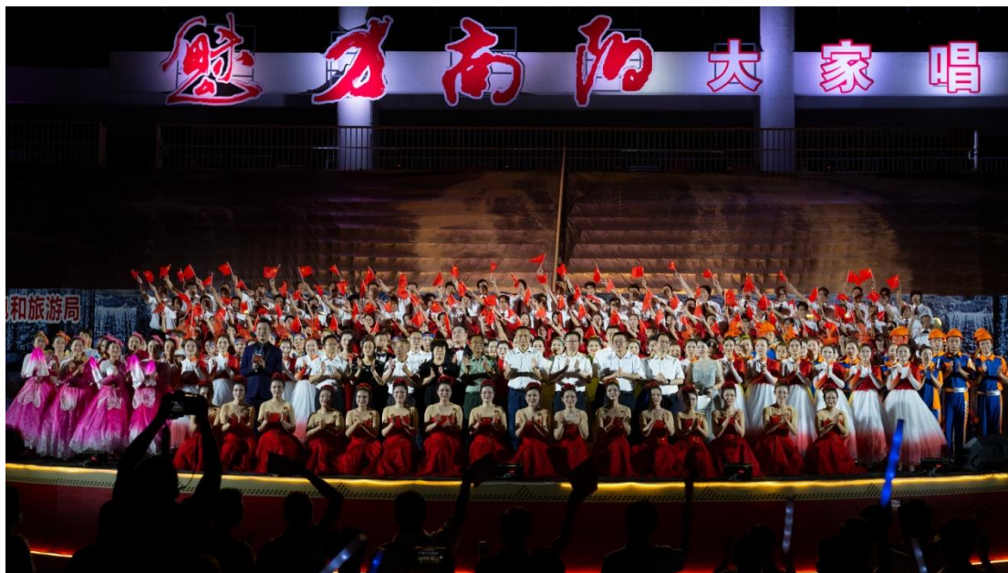
图 13 喜迎二十大 欢乐进万家——魅力南阳大家唱