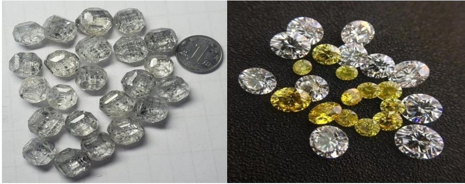
图 4 宝石级培育金刚石单晶毛坯（左）及宝石级培育金刚石（右）

研制任务立项；攻克 30 克拉以上宝石级培育金刚石大单晶及 10 克拉以上 MPCVD 培育钻石毛坯批量制备技术，产品品质达到世界一流水平；中南钻石顺利完成国家技术创新示范企业复评及河南省创新龙头企业评估；北方红阳与某高校合作开发的技术成果获得“2022 年度国防技术发明奖”一等奖。