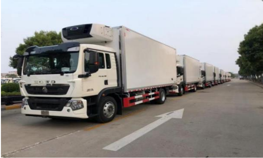
图 15 用于民生保供的冷藏保温车交付现场