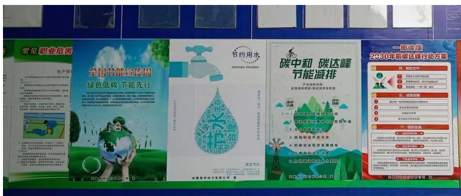
图 11 节能环保宣传教育墙

制定《排污单位环境保护分类管理名单》，对所属子公司实施重点、一般、关注分类管理；对产污环节、产污种类、污染防治措施定期分析；组织所属子公司对污染源、环境风险源及辐射源进行月度自查，开展公司巡查，深入对标对表开展举一反三整改，实现公司污染源、环境风险源及辐射源的有效管控。制定子公司年度自行监测方案，定期开展检测，检测结果符合国家污染物排放要求，重点排污单位按要求安装在线监测设施，并配合监管部门要求开展监测和信息公开。