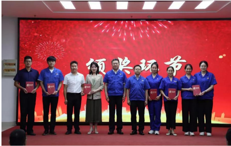
图 9 安全月活动颁奖环节

员，针对不同岗位量身定制“专属”培训教材，开展差异化的职工应知应会知识等培训和考试。“晓之以理和导之以利”，加强一线作业人员对本岗位安全操作规程和安全生产规章制度培训学习，掌握岗位操作技能和应急处置措施。组织各级管理人员经常性学习有关安全的最新法律法规、相关政策和标准规范，进一步提升自身的安全生产履职能力。