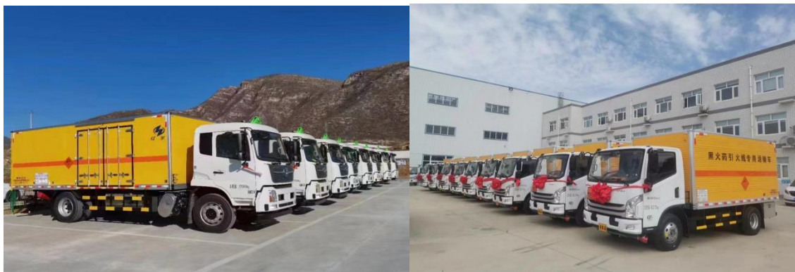
图 3 红宇专汽危险品运输车

专用车及汽车零部件业务板块 ，红宇专汽持续巩固爆破器材运输车市场占有率位居全国第一，冷藏保温车市场占有率位居全国前列的市场地位，并且利用其个性化的营销策略，大客户开发成效明显。银河动力主动加强与现有大客户互动交流和技术服务，稳步提升配套份额，积极拓展新客户，同时持续优化客户结构，退出信用差、无潜力客户 14 家；北方滨海利用大客户的影响和带动，汽车底盘结构件产品由单一零件向部件发展，车轴类产品逐步向轻量化车轴，一体式车桥及悬挂方向发展，培育了新的经济增长点。