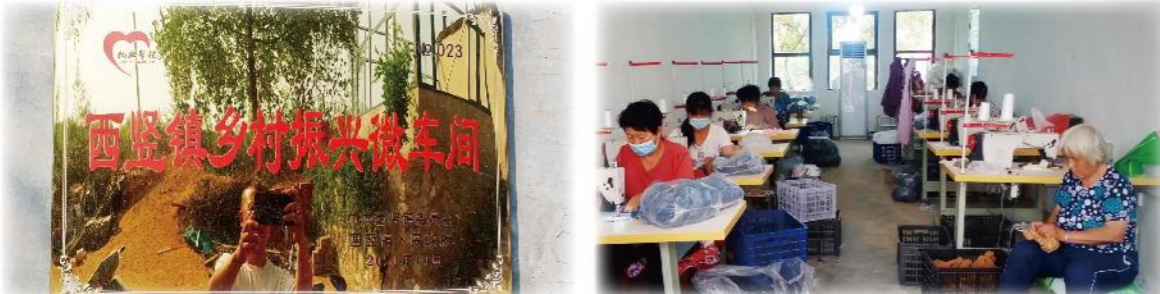
南三岐村 毛绒玩具代加工车间

武安本级驻邢台南三岐村扶贫工作队，按照各级乡村振兴局工作的安排部署，通过开展“坚守一个纪律底线、开展一系列政策宣讲、做好一个角色转变、发展一个集体经济项目、织密一张基层治理网格、办好一批民生实事的“六个一”活动，认真开展驻村工作。2022年所在村通过省级验收，被评为省级“美丽乡村精品村”。3月份驻村工作队被中共临城县委、临城县人民政府评为“先进驻村工作队”。