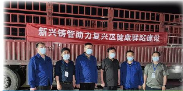
邯郸新材料助力 邯郸市复兴区健康驿站项目建设

芜湖新兴按照芜湖市团委统一安排部署，铸管及现有3个市级青年文明号以集体名义捐助7名困难大学生，共向芜湖市团委指定账户转账汇款28000元。先后围绕活动主题，走进江洲新城幼儿园慰问留守儿童、共建学雷锋志愿服务基地，共计捐赠11套留守儿童关爱包、100余本幼儿绘本及文具、教具。并参加“99公益日”爱心捐助行动。此外，积极投身公益献血，2022年芜湖新兴无偿献血创下企业历年献血人数和献血量之最，共有678人成功参与，总献血量达249800毫升全血和4个单位血小板（相当于800毫升全血）。迄今为止，芜湖新兴铸管在无偿献血的道路上已不间断地“长跑”20年，先后两次获得“全国无偿献血促进奖单位奖”。