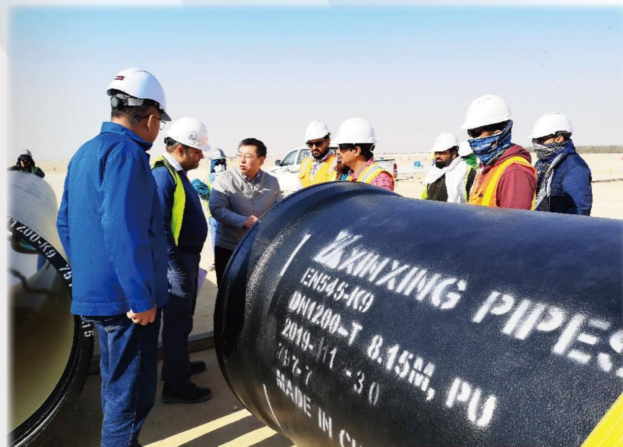
卡塔尔世界杯配套工程-卡塔尔D LINE项目售后服务