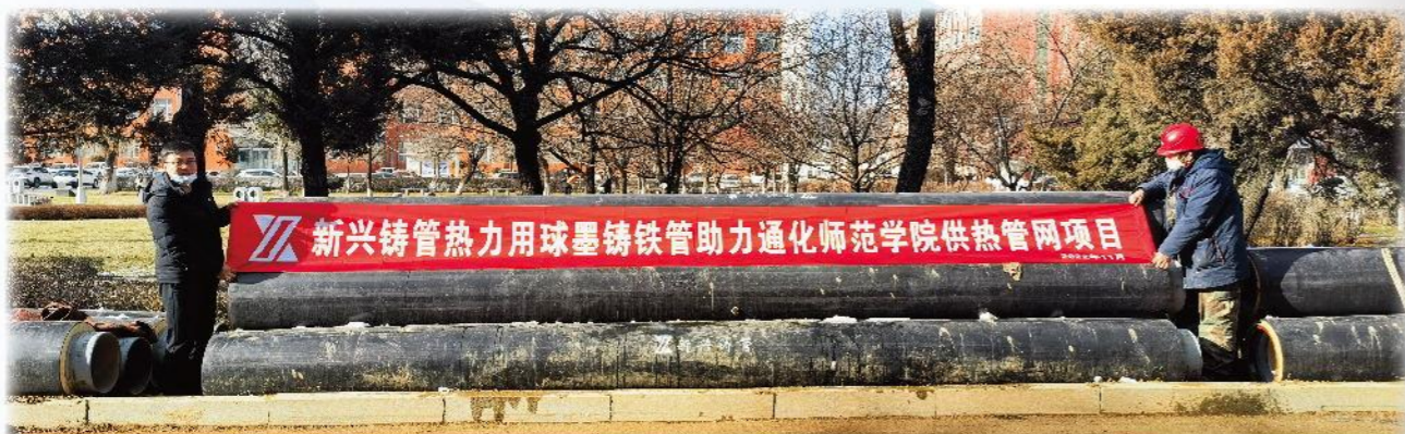
热力管项目售后服务