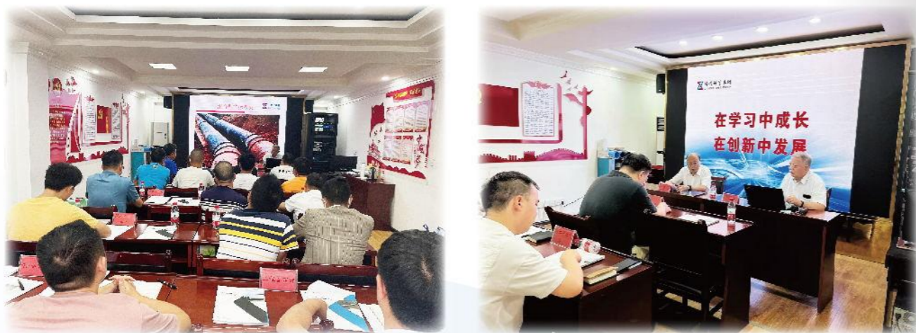
公司与贵州黔东南水投开展技术交流