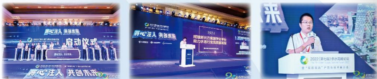
新兴铸管精彩亮相“2022供水高峰论坛”