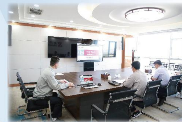
公司召开第2次临时股东大会