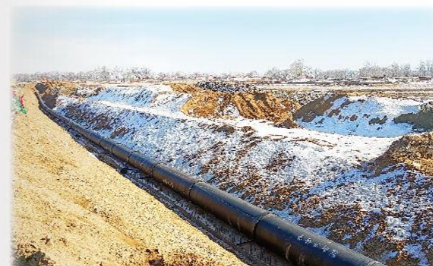
新兴铸管助力岱海生态应急补水工程