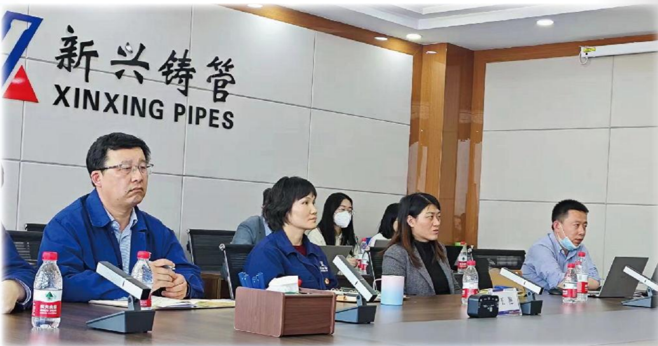
经营合规管理年专项行动动员部署会