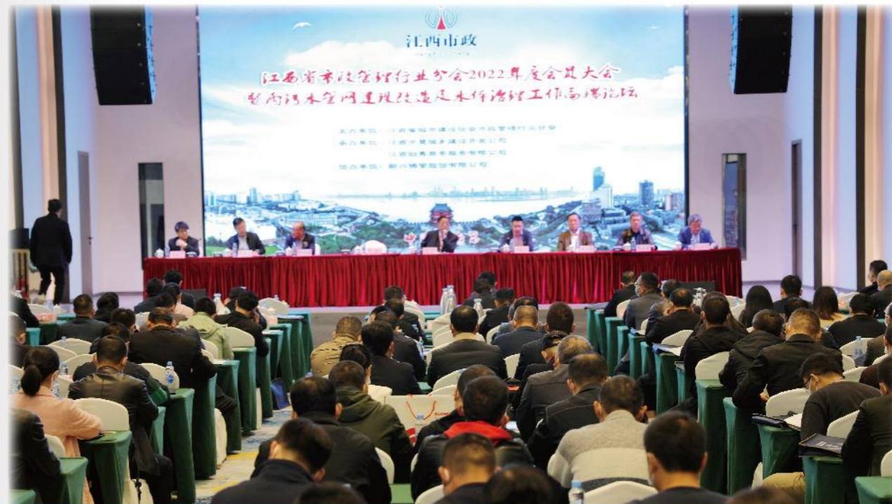
江西南昌《排水球墨铸铁管道工程技术规程》导则宣贯会技术交流