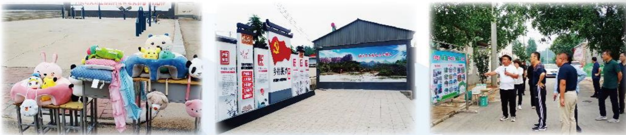
临城县组织参观学习南三岐村人居环境治理, 美丽乡村建设和毛绒玩具加工产业项目