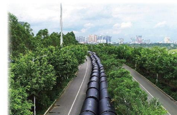
南宁邕江上游引水工程 (口径:DN2600mm 工作压力:0.6MPa 长度:8km)