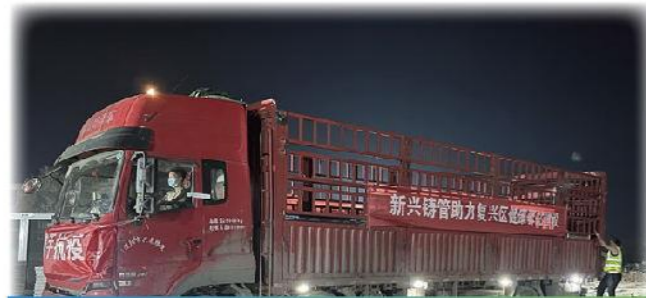
邯郸新材料助力 邯郸市复兴区健康驿站项目建设

公司积极投身社会公益事业，2022年4月，所属企业邯郸新材料驰援邯郸市复兴区健康驿站项目建设，为该项目紧急提供引水管道供应保障工作，共捐赠各种复合管件1244套，管材465支（3194米），物资共计19.8万元。考虑到健康驿站建设现场施工情况，邯郸新材料为施工现场配备1台扩口机、1台台锯，全力保障现场施工的需求；并指派2名专业技术人员提供安装技术指导，彰显央企担当。