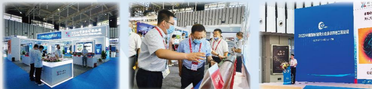
新兴铸管精彩亮相2022中国国际管网展

2022年,公司稳步推进信息安全保障工作,全面落实公司各项信息安全可靠防范措施。其中,修订信息安全类制度2项,开展网络安全应急演练5次,攻防演练9次,举办网络安全技能培训3次。利用国家网络安全宣传周,通过大屏、易拉宝等途径进行宣贯,提高全员信息安全意识,并组织签订《网络安全承诺书》。通过多管齐下,保证了各类信息系统安全稳定运行。