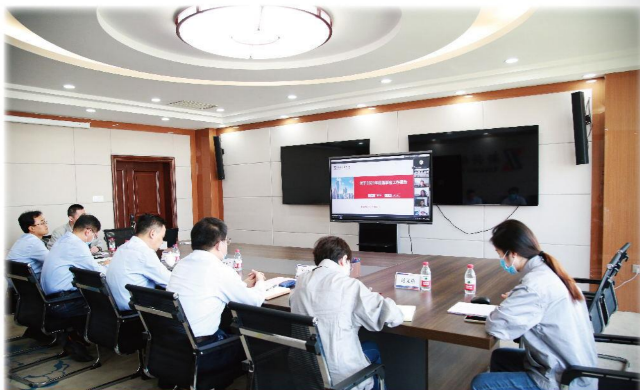
第九届董事会第十一次会议