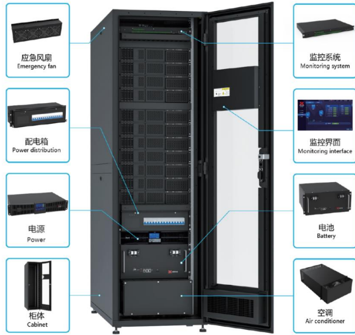
图：一体化机柜结构图

公司电源类产品主要是为基站相关设备提供交直流配电、开关电源、过载保护等功能的器件。公司电源类产品可以单独销售，也可以根据客户需求随同公司其他产品集成为解决方案类产品出售。公司独立销售的电源类产品形态主要如下图所示：