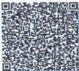
程罗铭的年检二维码