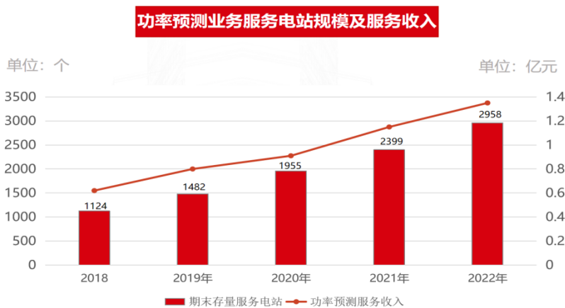
图 2：国能日新近五年功率预测业务服务电站数量示意图

报告期内，公司新能源功率预测业务在存量客户服务费规模稳步增长的同时，克服组件价格维持高位、下游光伏地面电站建设并网进度放缓的不利环境，进一步拓展了新增用户，公司服务电站数量逐年增长（见下图），报告期内净新增电站用户数量高达 559 家，公司服务电站数量已由 2021 年底的 2,399 家增至 2,958 家。使得功率预测服务累积效应逐渐凸显，具有高毛利水平的功率预测服务规模持续上升。