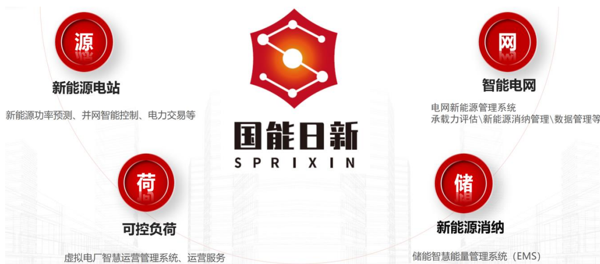
图 1：国能日新主要业务和产品示意图

报告期内，公司实现营业收入 35,953.06 万元，同比增长 19.78%；实现归属于上市公司股东的净利润 6,708.21 万元，同比增长 13.36%。其中，公司股权激励计划带来股份支付费用约 431.98 万元，已经计入本报告期损益。公司非经常性损益对归属于上市公司股东的净利润的影响金额为 582.10 万元，主要为政府补助、闲置资金投资理财收益所致。