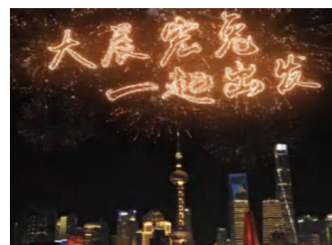
风语筑 X 东方明珠 2023 跨年 AR 秀