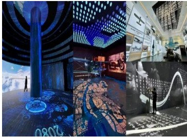
南昌市规划展示中心

数字化体验空间通过数字化的技术手段展示城市历史文化底蕴、发展历程、建设成就和未来规划愿景，是各地开展政务接待、招商引资、规划展示和城市形象宣传的重要窗口和平台。代表作品：