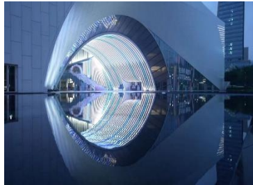
深圳光明区规划展览馆