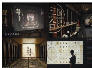
三国合肥历史文化馆