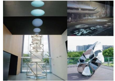
上海嘉定新城规划展示馆