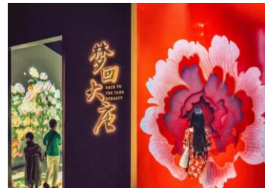
洛阳中国牡丹博物馆