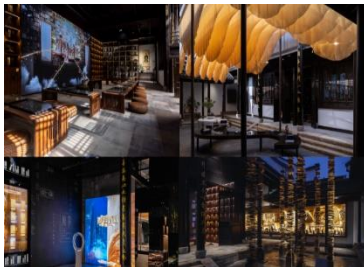
《典籍里的中国》陈列馆

文化及品牌数字化体验空间通过将创意、设计、数字艺术和沉浸式体验元素深度融合 IP 主题、在地文化特色和品牌形象之中，重点打造面向社会大众和消费者开放的新型互动体验式空间。代表作品：