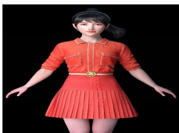
安徽广播电视台 数字虚拟人“小安”