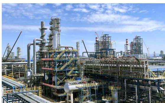
图9：NCC钢结构应用于石油化工领域