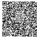
南京普飞储能设备(集团)股份有限公司2022年度 非经营性资金占用及其他关联资金往来情况汇总表