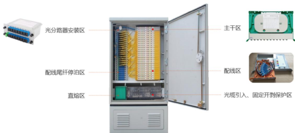
图：无跳接光缆交接箱