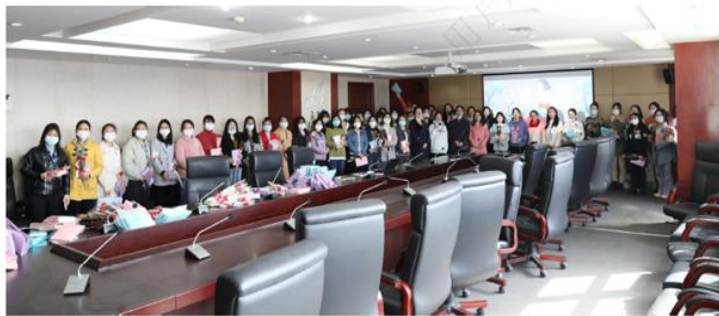
国际劳动妇女节主题活动

外运动场馆，供员工工作之余放松心情，强身健体，开展了“羽我同行”羽毛球比赛，高德“活力杯”篮球比赛；设置职工心理咨询室，提供心理咨询平台，开展心理咨询课程，重视公司员工心理健康问题；设置“母婴室”，帮助哺乳期母