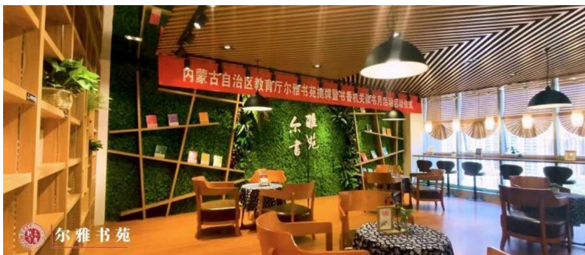
自治区教育厅“尔雅书苑”举行揭牌暨书香机关读书月活动启动仪式