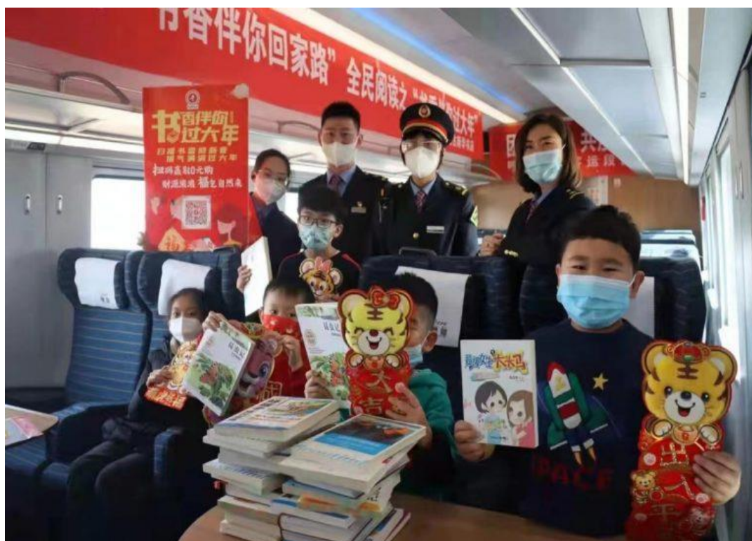
内蒙古新华书店“书香伴你过大年——书香专列”启程