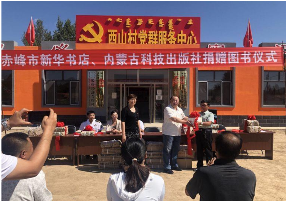
赤峰市子公司到翁牛特旗解放营子乡西山村开展“乡村振兴 志智服务” 图书捐赠活动

公司高度重视基层文化服务工作，充分运用好农牧民草原书屋这一重要阵地，开展“乡村振兴 志智服务”图书捐赠、文化科技卫生“三下乡”、“情暖戈壁 守土戍边”综合志愿服务等活动，通过图书配送、技术指导、惠民服务、精品打造、主题营销等方式，为边境苏木、嘎查送理论、送文艺、送温暖，进一步提升草原书屋的吸引力和利用率，打通了公共文化服务群众的“最后一公里”，为乡村振兴注入文化活力。