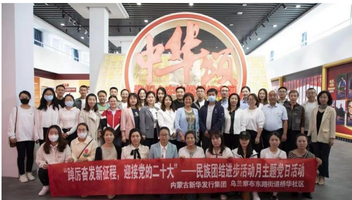
创新主题活动 凝聚奋进力量