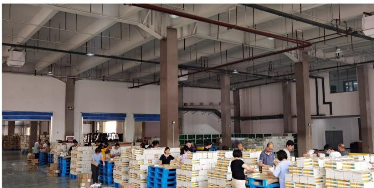
“两教”发行 新华护航——全力保障“课前到书 人手一册”圆满完成