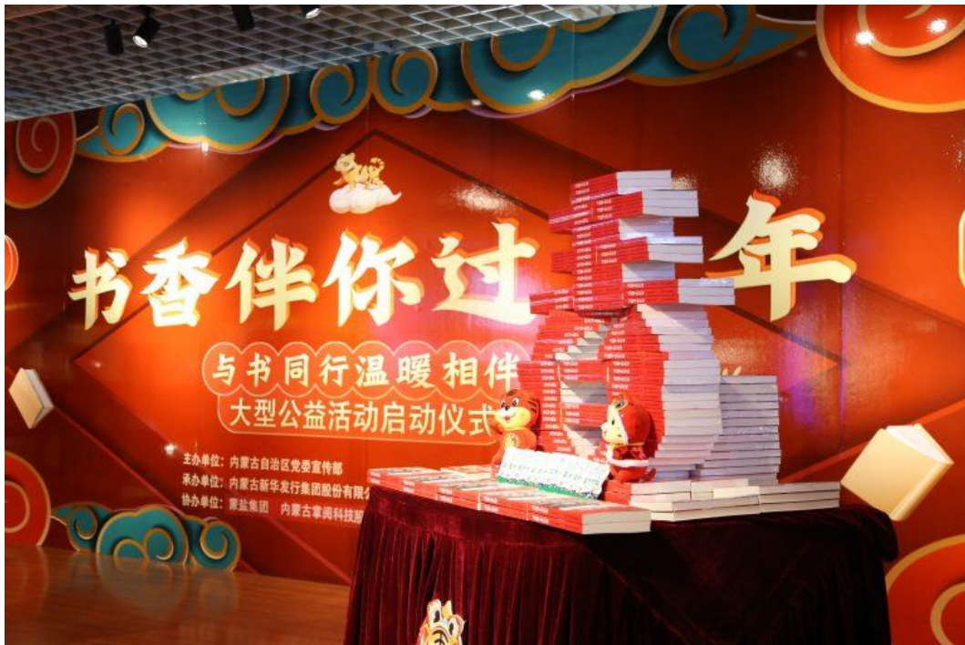
“书香伴你过大年”大型公益活动启动仪式在内蒙古新华书店隆重举行

不断扩大、方式不断创新，新建“七进”店 8 家，投放自动售书机 5 台，开展全民阅读活动 2 万余场，全民阅读热情持续攀升；持续推动“鸿雁图书悦读”与草原书屋一体化建设，新建农牧区家庭书屋 12 家、草原书屋中心书屋 133 家，开展流动售书 1156 场，真正让文化惠民便民，擦亮扮美新华书店品牌。