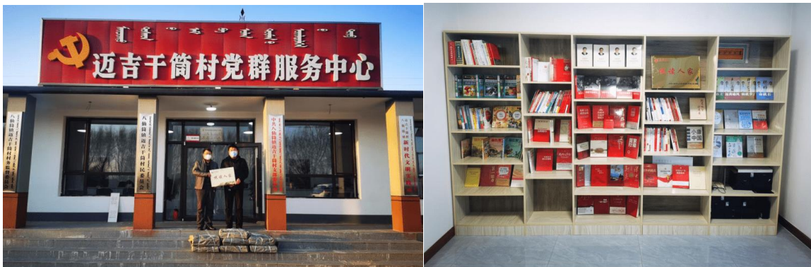
通辽市子公司农牧区家庭书屋揭牌仪式在奈曼旗八仙筒镇迈吉干筒村举行