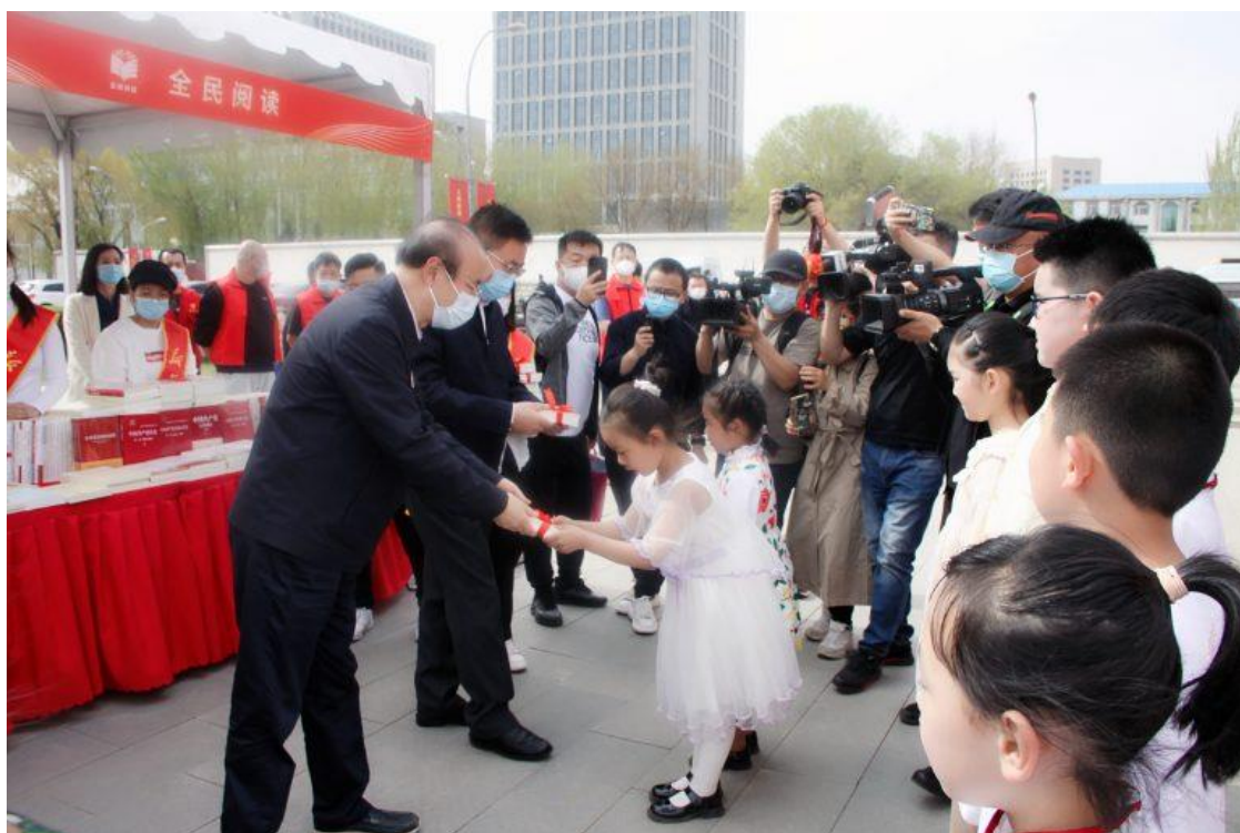
“阅读新时代 奋进新征程” 2022 年书香内蒙古全民阅读活动启动仪式 在呼和浩特举行