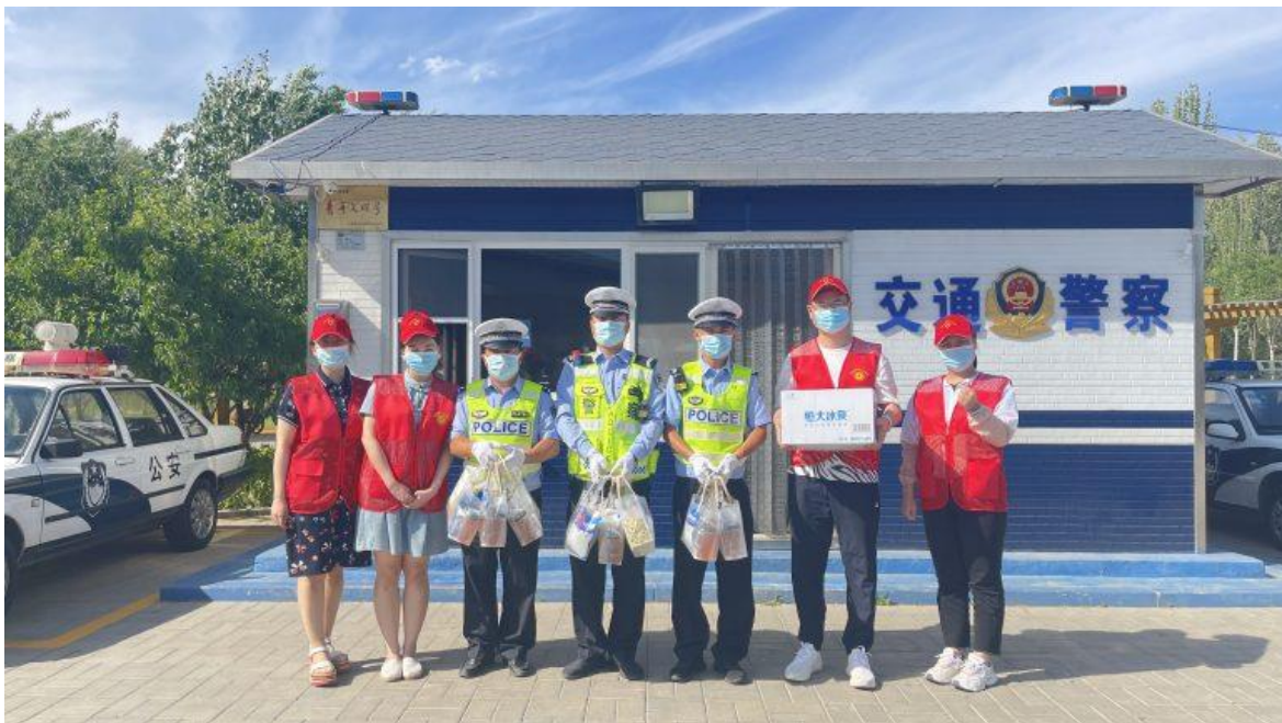
“夏日送清凉 情系一线工作者”志愿服务活动