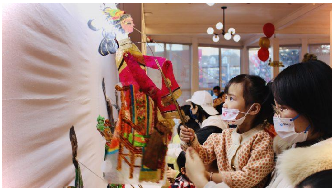
赤峰市“书香伴你过大年”大型文化公益活动启动