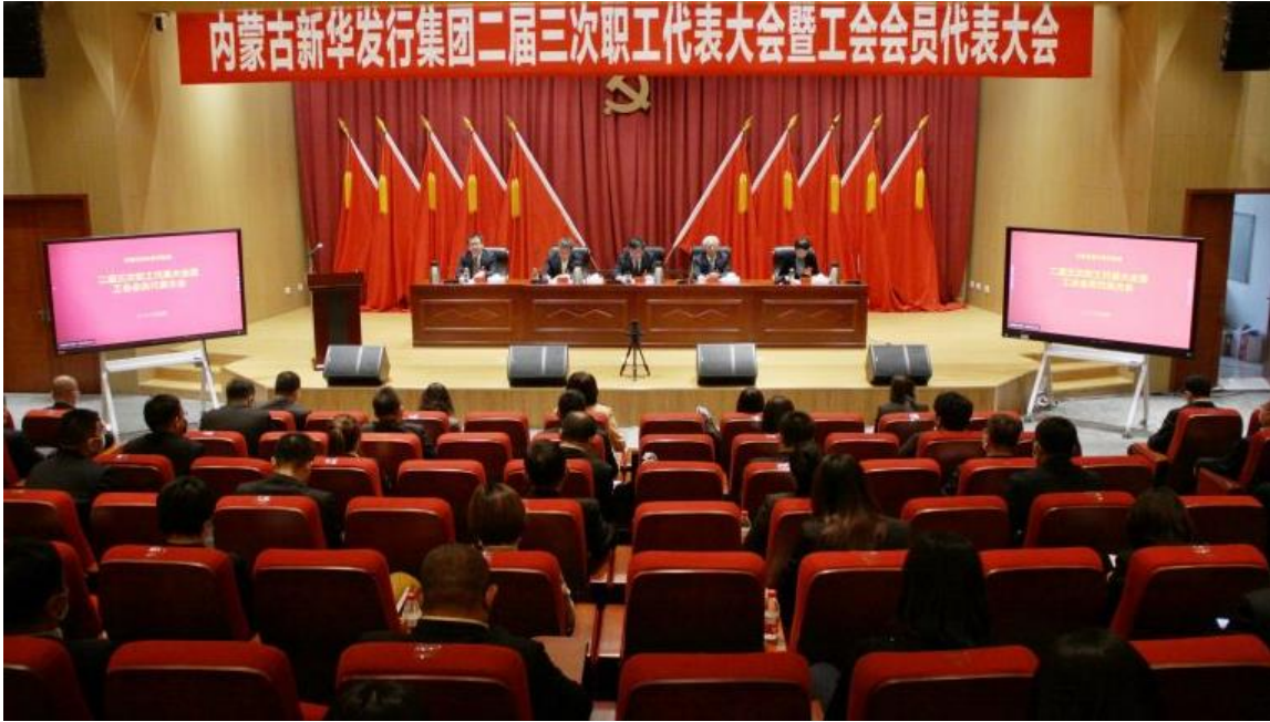
第二届第三次职工代表大会暨工会会员代表大会在呼和浩特召开