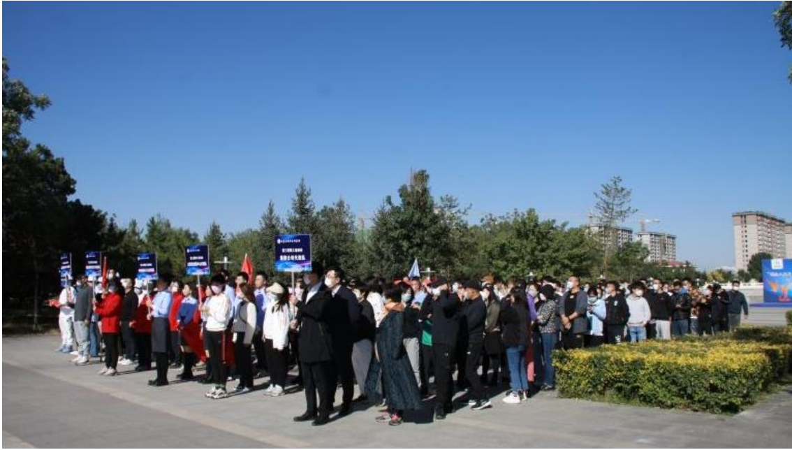
工会开展“喜迎二十大 建功新时代”职工线上健身运动会启动仪式暨健步走活动

公司始终秉持以人为本的理念，大力推进企务公开、民主管理，召开职代会，职工代表审议多个制度性规范文件和企业重大项目，员工积极主动参与企业经营管理，各级工会持续开展医疗互助保障行动，对困难员工进行摸底调查，建档立卡，捐赠帮扶，为百名职工送上生日祝福卡，开展“夏日送清凉 情系一线工作者”“我为群众办实事”等活动，组织形式丰富的线上运动会、书法摄影及业务技能大赛、知识竞赛、培训讲座等活动，丰富职工精神文化生活，筑牢企业发展根基。