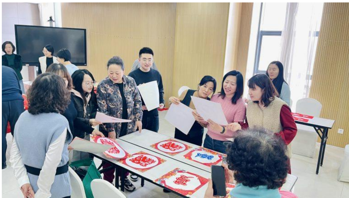
“迎新春 送福气”写对联剪窗花活动

未来公司将再接再厉，履行社会责任，彰显担当使命，用实际行动服务大众，回馈社会，积极响应国家号召，助力创造美满有序的和谐社会。