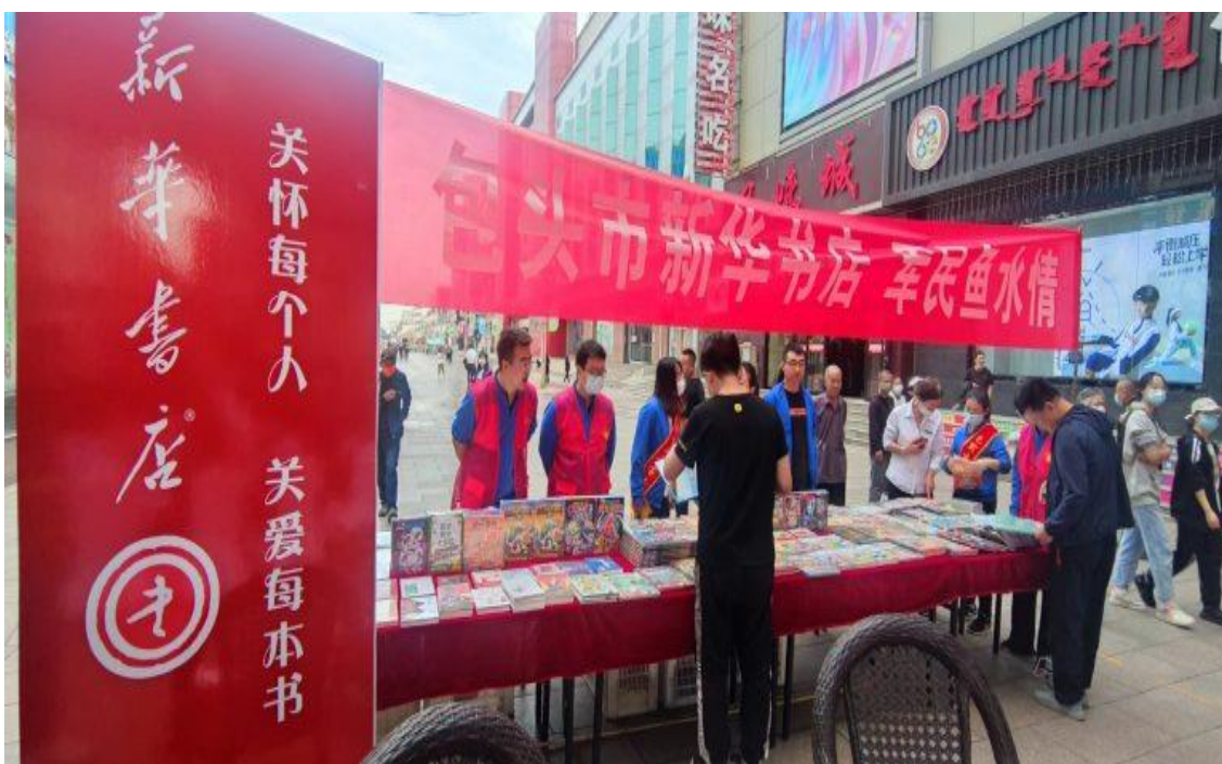
包头市子公司组织开展“军民鱼水情”主题优秀文化产品展销