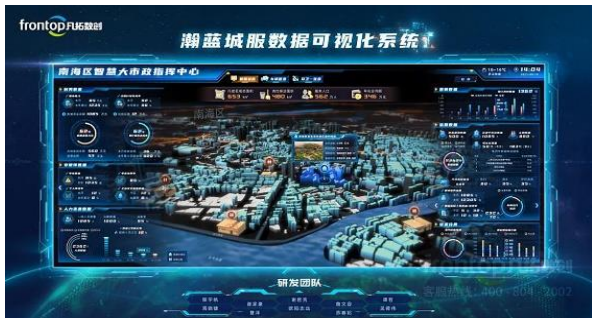
瀚蓝城服数据可视化系统