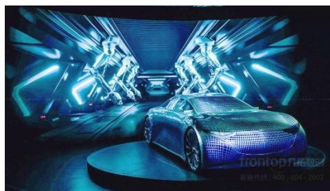
伊之密全球创新中心展厅多媒体展项