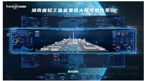
湖南轻盐数智展示中心