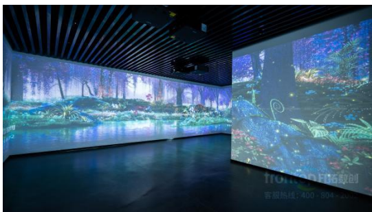
贵州六盘水智慧农旅数字生态体验中心