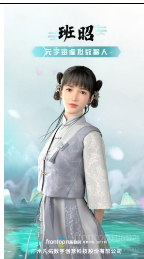
元宇宙虚拟数智人-班昭