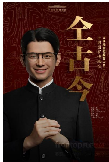
国家博物馆-全古今