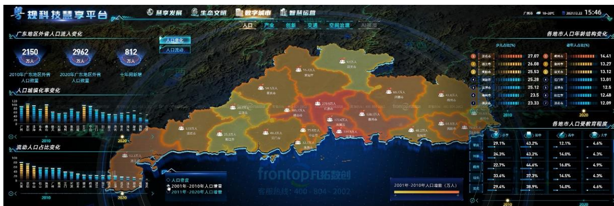
省设计院粤规科技慧享平台

凡拓数创基于国产化 B/S 架构，自研 FT-E 数字孪生渲染引擎，融合 GIS、BIM、CIM 技术，可容纳城市级数据，实现毫秒级动态渲染，从物理层到操作系统信创全流程认证，安全等级符合国家规定，全链条集成与兼容政企、工业、互联网多源异构数据，融合多媒体交互与 AI 数字人技术，实现多端联动、智能音控等操作。平台已通过华为公司的认证，为产业数字化赋能，为市政、环境、安防、应急、工业制造等应用领域提供数字孪生解决方案。