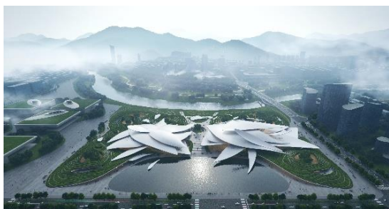
MAD 安吉文化艺术中心

静态数字创意服务，即利用计算机图形图像制作和处理技术，根据客户提供的平面图或结构图，通过电脑三维仿真软件模拟真实环境，将创意构思三维化、仿真化，为客户提供三维效果图等图像及设计服务。目前，公司静态数字创意服务主要应用在建筑设计、规划设计、勘测设计等领域。