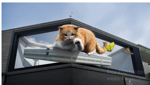
慕思品牌宣传裸眼 3D 视频

强现实系统、数字沙盘、数字多媒体交互系统、立体（全息）成像系统、应用软件开发等）。公司以持续的创新动力，不断提高 3D 可视化及数字多媒体交互技术的研发、制作能力，助力 3D 数字新体验。