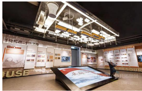
沈阳英雄人物故事体验馆