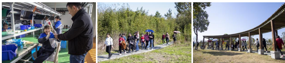
公司妇女节组织游玩

公司工会组织始终以维护职工合法权益为己任，保持员工队伍的团结，动员组织员工支持、促进和谐企业建设；支持企业合法经营、科学管理，着眼于员工的切身利益，积极参与协调劳动关系，妥善处理劳动争议，促进劳动关系双方相互尊重、平等合作，努力构建和谐企业。公司工会在端午、中秋、春节等重大节日对在职工工表示节日慰问。2022年公司组织了丰富的三八妇女节和各类慰问活动，让每一位女职工充分感受到公司的关怀。